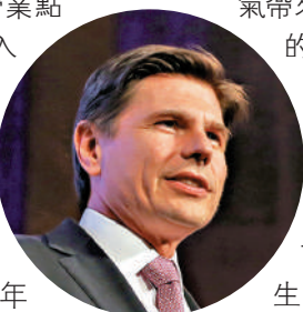
港交所行政總裁歐冠昇

他又稱，已有可靠的技術來保障安全、順暢的遙距工作，相信是時候與全球其他主要市場同步。