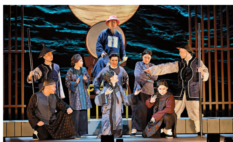
▶《大狀王》昨晚起於戲曲中心大劇院開啟一連20場演出。

為了慶祝重回劇場，音樂劇《大狀王》昨日首場演出前舉辦開幕酒會。香港特別行政區政府律政司司長林定國，西九文化區管理局表演藝術委員會主席翟紹唐，香港話劇團理事會主席蕭楚基為首演擊鼓揭幕。香港特別行政區政府財政司司長陳茂波、西九文化區管理局行政總裁馮程淑儀，以及超過200位獲邀嘉賓於酒會後一同欣賞《大狀王》。