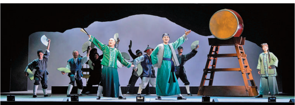
▶《大狀王》雲集全港頂尖音樂劇台前幕後班底。

《大狀王》今年六月橫掃「第三十一屆香港舞台劇獎」十項大獎，勇奪最佳製作、最佳原創音樂(音樂劇)、最佳填詞、最佳導演、最佳男主角和男配角(悲劇/正劇)等獎項，成為今屆舞台劇獎獲獎數目最多，以及自「香港舞台劇獎」於1992年創辦以來獲提名最多的作品——合共獲10個獎項以及15項提名。