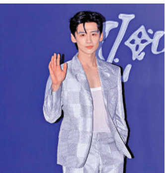
▶白敬亭在拍劇空檔從內地來港，出席時裝騷。