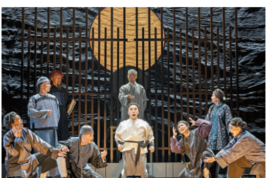
▶《大狀王》將中國民間故事以西方歌劇的方式來表達。