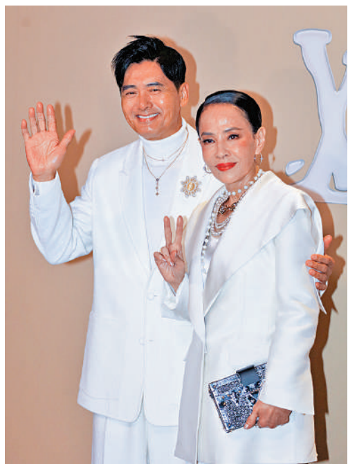
▶周潤發與妻子陳薈蓮有影皆雙。

國際品牌LOUIS VUITTON 2024初秋男裝系列時裝騷，昨晚於尖沙咀星光大道舉行，雲集逾80位世界各地名人、藝人出席，星光熠熠，是香港近年亦是新冠疫情後，其中一個最大型的時尚活動。這次LV選址香港辦時裝騷，之前已成城中熱話，線上線下都引起熱烈討論，明星藝人紛紛在網絡展示獲邀出席的邀請函，網友則猜測哪個人氣偶像會出席這個時裝盛會。