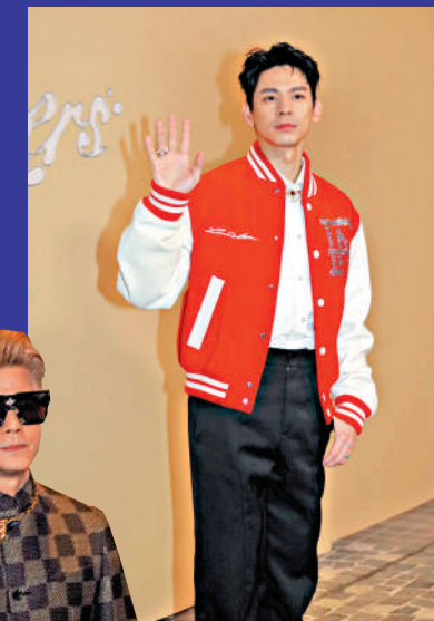
▶台灣男星林柏宏在香港有不少粉絲。