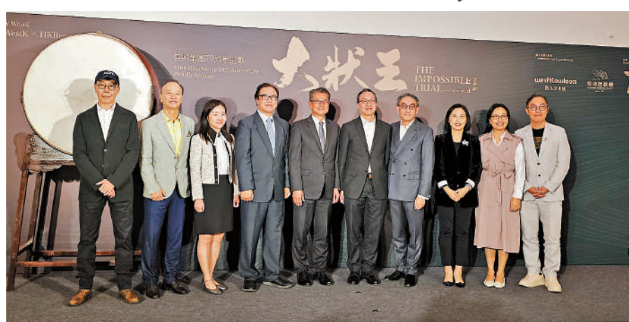
▶嘉賓出席《大狀王》首場演出及開幕禮。