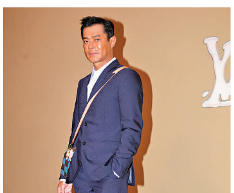
▶古天樂投資的新片票房理想，近日忙於謝票。