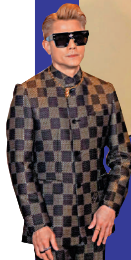
▶郭富城開時會教女兒兒行catwalk。