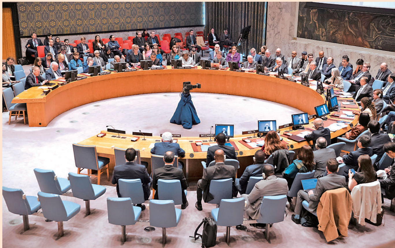
▲當地時間11月29日，安理會巴以問題高級別會議在紐約聯合國總部舉行，會議由中共中央政治局委員、外交部長王毅主持，近20個國家的外長和高級別代表以及所有安理會成員出席。

五、尋求政治解決。根據安理會相關決議和有關國際共識，解決巴勒斯坦問題的根本出路是落實「兩國方案」，恢復巴勒斯坦民族合法權利，建立以1967年邊界為基礎、以東耶路撒冷為首都、享有完全主權的獨立的巴勒斯坦國。安理會要推動重啟「兩國方案」，在聯合國主導和組織下，盡快召開更大規模、更具權威、更有實效的國際和平會議，制定落實「兩國方案」的具體時間表和路線圖，推動巴勒斯坦問題全面、公正、持久解決。關於加沙未來的任何安排都必須尊重巴勒斯坦人民的意願和自主選擇，不能強加於人。