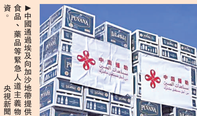
▲中國通過埃及向加沙地帶提供食品、藥品等緊急人道主義物資。

日前，中國國家主席習近平在出席金磚國家領導人巴以問題特別視頻峰會時宣布，為緩解加沙人道主義局勢，中國通過埃及向加沙地帶提供食品、藥品等緊急人道主義物資。11月28日，包括罐頭、餅乾、牛奶、蜂蜜、麥片、飲用水等在內的8車物資啟運前往埃及阿里什，將通過拉法口岸運往加沙。