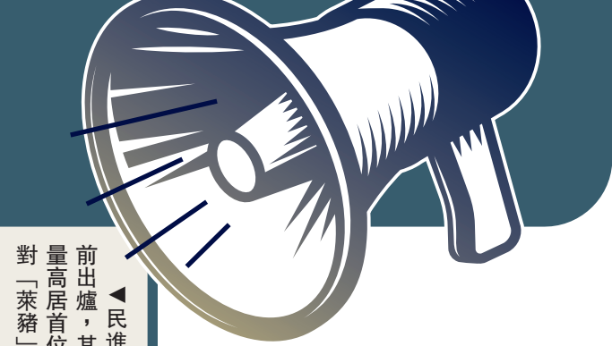
民進黨十大「執政」民怨日前出爐，其中「開放萊豬進口」聲量高居首位。圖為台灣民眾集會反對「萊豬」輸入。資料圖片