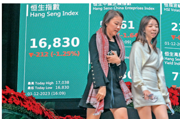
▲ 港股試低位，但內地資金積極趁低入市。

盈富基金（02800）是北水主力吸納對象，全日淨買入20.81億元。美團（03690）昨日獲北水淨買入9.84億元，是第二多內地資金淨買入股份。美團股價最多跌5.7%，全日跌2.9%，收報87.9元，是2020年3月下旬以來低位。小米（01810）是少數遭北水淨賣出股份，昨日淨賣出4.65億元；小米股價回吐2.9%，收報15.16元。