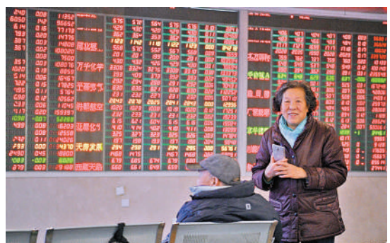
內媒引述業內人士稱，國資再出手，有利於提振市場情緒。

業內人士指出，此次國新投資出手布局ETF，顯示出對後市的信心，股票ETF基本接近95%以上高倉位運作，買入ETF對於提振整體市場作用也會比較明顯。國新投資增持構成利好因素的一環，有利於市場情緒的修復，短期風險偏好看好有望改善。