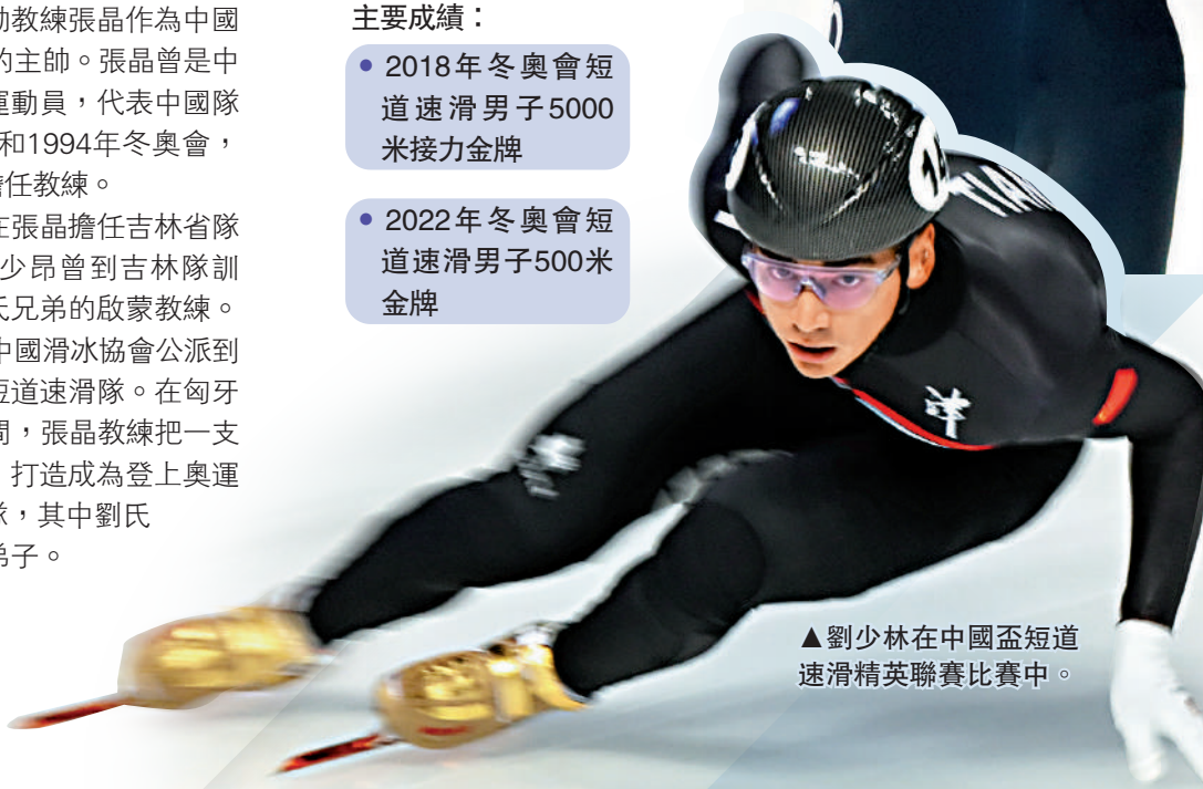
▲劉少林在中國盃短道速滑精英聯賽比賽中。