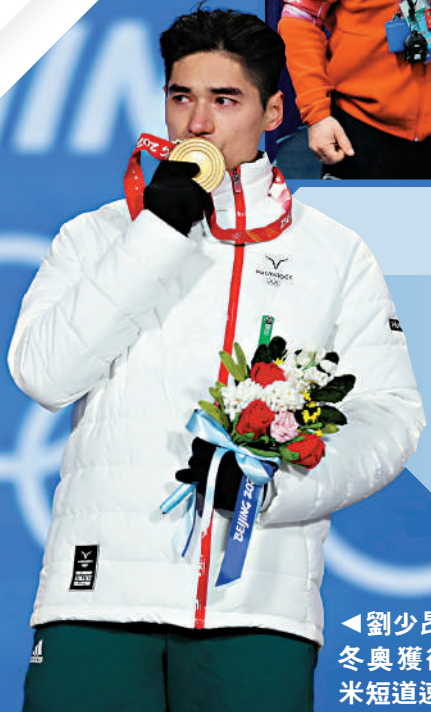
▲劉少昂在北京冬奧獲得男子500米短道速滑金牌。