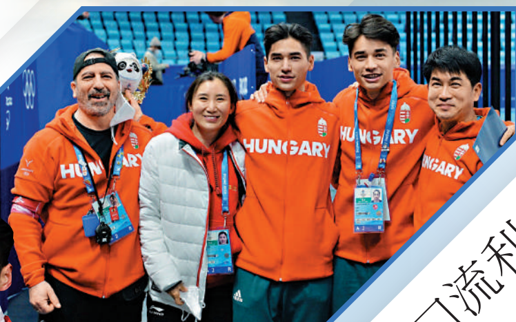
▲劉少林（右二）及劉少昂（右三）在北京冬奧代表匈牙利比賽。