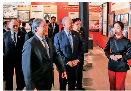
▲12月2日，嘉賓參觀展覽。