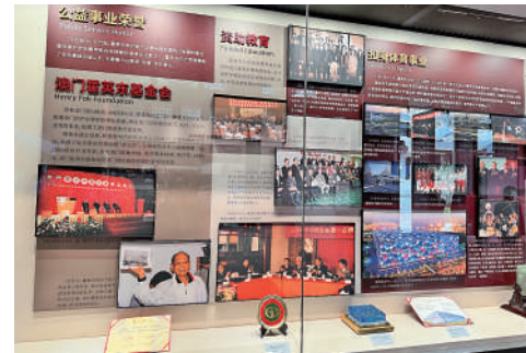
▲霍英東廣泛參與祖國的社會福利事業。

2日，位於廣州南沙大角山北麓的霍英東紀念館舉行開館儀式，來自粵港澳等地的嘉賓齊聚一堂，共襄盛