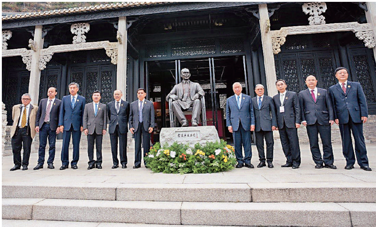
▲今年正值霍英東先生誕辰100周年。12月2日，位於廣州南沙的霍英東紀念館正式開館。