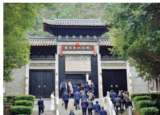
▲霍英東紀念館正式開館，嘉賓觀衆進入展館參觀。