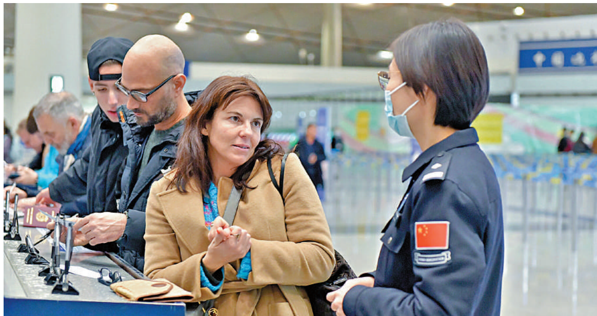
▲12月1日，中國對法國、德國、意大利、荷蘭、西班牙、馬來西亞6國持普通護照人員實施免簽入境政策。圖為享受免簽入境的意大利遊客與中國邊檢工作人員交流。

國家移民管理局相關負責人介紹，為確保免簽入境政策順利實施，進一步促進中外人員往來和交流合作，全國邊檢機關優化警力部署，加強現場引導，開足查驗通道，確保口岸高效、順暢通關。同時，國家移民管理局指導各地公安機關出入境管理部門依法依規為免簽入境人員提供停居留便利。