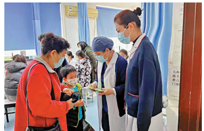
▲近期，內地多地高發呼吸道感染性疾病。圖為家長帶孩子去醫院就診。

接種疫苗是預防流感等傳染病的最佳手段之一。王大燕就此表示，流感高發季節，對之前沒有接種流感疫苗的人群，接種流感疫苗仍有效。她表示，6個月以上的人群都可以接種流感疫苗，尤其是對於兒童及老年人、慢性病患者等高風險人群，在感染流感後發生重症的風險較高，接種流感疫苗可以有效降低發展為重症和死亡的風險，希望公眾積極接種。