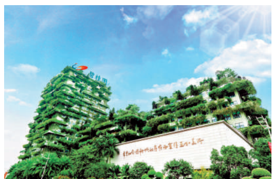
▲碧桂園今年首11個月累計交付約50萬伙住宅，涉及240座城市。

【大公報訊】陷入債務危機的碧桂園（02007）或尋求調整組織架構。據中證金牛座消息，碧桂園進行最新組織架構調整，合併14個區域公司為7個新區域。消息得到接近碧