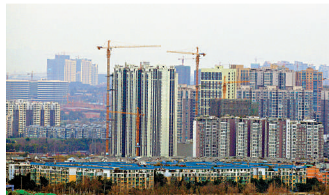
▲六大銀行召開房企座談會，積極表態支持房企融資。

支持從事「三大工程」相關建設業務的發行人通過債券市場開展融資。」「在實際工作中，我們成立專項工作小組，逐一對接排摸企業項目需求，積極鼓勵各類企業在發行公司債券（含企業債）的同時，充分運用資產證券化及REITs產品，用好用足債市工具，滿足企業合