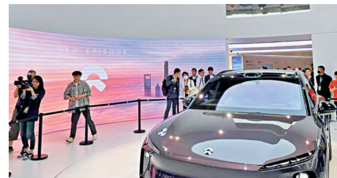
▲蔚來第三季度汽車交付量5.5萬輛，創下季度新高。

對於近期蔚來與長安汽車及吉利控股簽署換電業務合作協議，李斌表示，經過5年的發展，蔚來換電網絡和蔚來能源雲在研發、建設、運營等方面已積累豐富經驗，蔚來換電業務已做好向行業開放的準備。他又透露，正和幾間公司就換電進行談判中，並相信換電業務可持續發展，且屬盈利很好的業務。