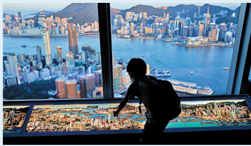
▲香港私營經濟擺脫連續4個月的收縮，11月營商環境轉趨穩定。