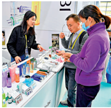
▲中國服務業市場信心略有增強，部分企業預期經濟環境改善。

不過，受各種不利因素影響，內外部需求仍有不足，就業壓力仍然偏大，經濟回升基礎還需進一步鞏固。展望未來，政策層面仍需圍繞擴大消費、增加收入、促進就業、穩定預期做文章。