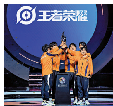
▲深圳DYG奪得2023電競上海大師賽《王者榮耀》項目冠軍。

eStarPro抓住一波團戰勝利的機會扳回一城。但第四局，DYG陣容更具進攻優勢，雖然eStarPro守住一波高地進攻，但最終DYG仍以3-1獲勝奪冠。