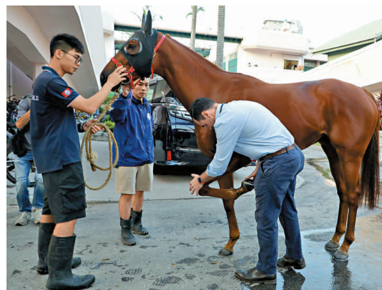
▲獸醫在賽前檢驗賽駒，確保參賽馬適宜出賽。