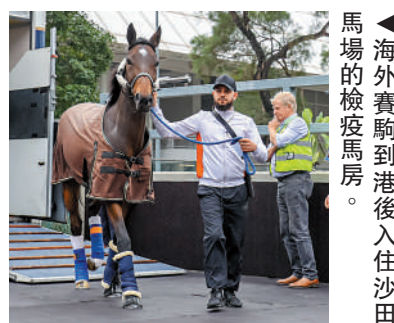
▲海外賽駒到港後入住沙田馬場的檢疫馬房。