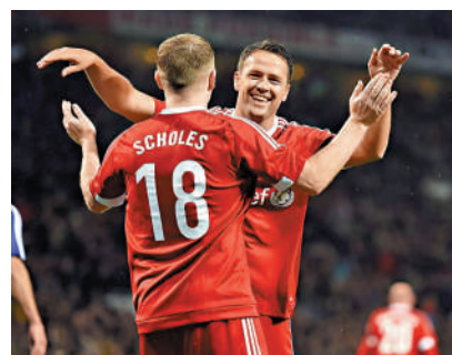
▲史高斯（左）與奧雲（右）近年不時參與表演賽。

【大公報訊】香港球迷「有眼福」！「世界足球傳奇盃2024」昨天宣布，明年1月20日在香港大球場舉行賽事，屆時兩名英超傳奇球星奧雲與史高斯，將分別組成「奧雲大師隊」及「史高斯傳奇隊」交鋒，陣中尚有13名國際名將，他們會聯同本地名宿及香港各界名人，