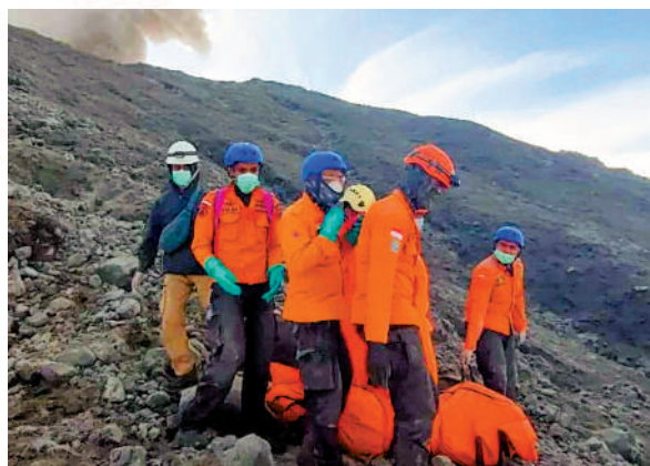
▲印尼救援人員4日將一名遇難者遺體從馬拉皮火山上抬走。

據印尼當局稱，在馬拉皮火山3日首次噴發時，有75名登山客在山上。目前已有50多名登山客安全撤離，多人被燒傷並骨折。在先前於火山上發現了11具登山客屍體後，巴東搜救機構負責人馬利克表示，救援人員分別於4日和5日又發現了共11具屍體。據官員稱，截至周二中午，火山仍在噴發，導致200多名人員的救援工作進展緩慢。