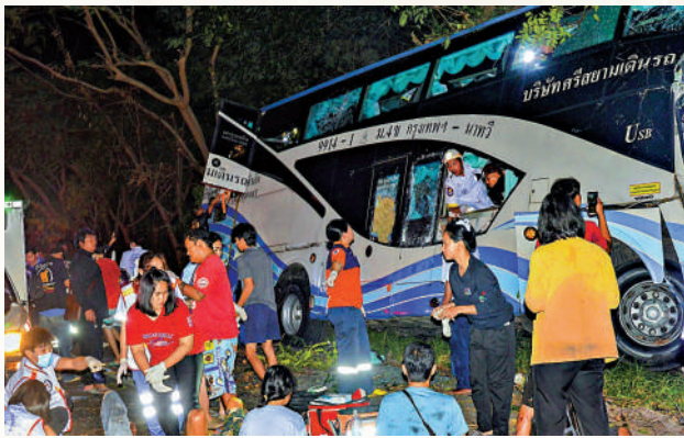
▶泰國旅遊巴5日在巴蜀府發生車禍，導致多人死傷。

經中國駐泰國大使館與泰國警方及相關部門核實，上述車禍中目前暫未有中國公民傷亡。報道稱，泰國是世界上道路交通事故發生率最高的國家之一，每年導致數千人死亡，據泰國道路事故數據中心稱，僅去年一年，就有1.5萬人死於車禍。