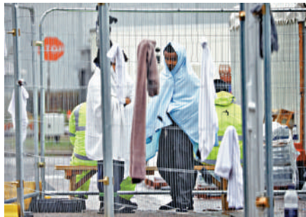
◀去年11月，英國曼斯頓移民居留中心被曝光苛待非法移民。資料圖片

英國保守黨移民政策的重要內容，但英國對待非法移民的方式引發爭議，受到人權組織批評。去年底，英國當局被指責苛待來自阿富汗、敘利亞和伊拉克等地的非法移民，將數千人關押在設計容量僅為1500人的肯特郡曼斯頓移民居留中心。該居留中心內部極為擁擠，衛生條件惡劣，被關押者患上白喉等傳染病。將非法移民移送盧旺達的計劃同樣飽受批評。