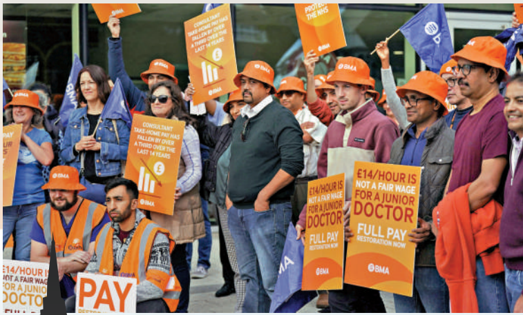
◀英國醫療系統面臨人手短缺、醫護罷工要求漲薪等問題，禁止海外醫護攜親屬赴英或加劇醫療系統壓力。