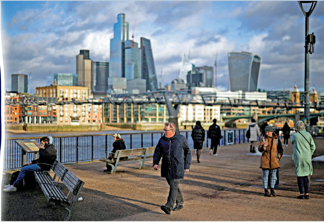
◀英國大選將至，蘇納克政府希望通過限制移民人數爭取選民支持。圖為泰晤士河畔的英國民眾。資料圖片