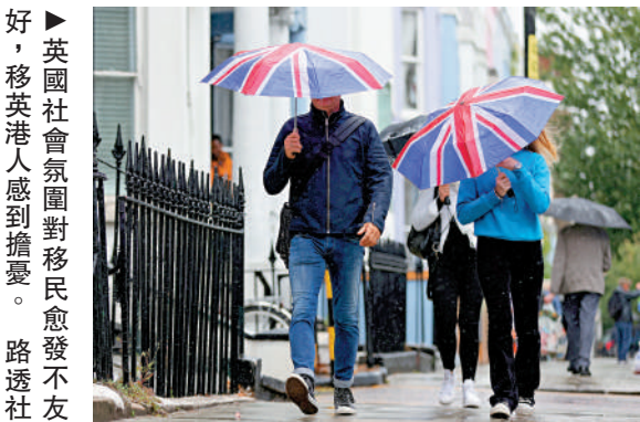
好，移英港人感到擔憂。

英媒今年稍早曾披露，英國內政部官員正在考慮將移民申請入籍前的持續居留時間由5年延長至8年。一名政府消息人士稱，成為英國公民是一種「特權」，只有為英國「作出貢獻」的人才能獲得。若此消息成真，BNO移民將受到嚴重影響。根據英國政府3年前的說法，BNO移民在英國連續生活5年即可申請定居，再居留1年就能申請入籍。