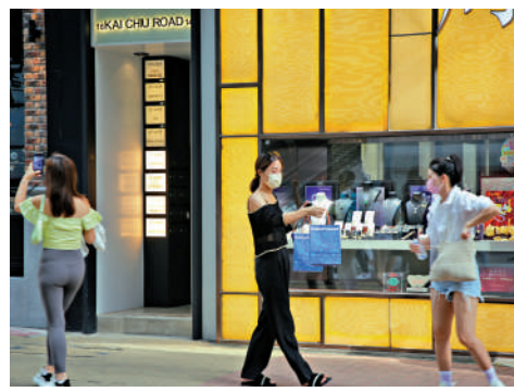
▲香港零售業面對結構性調整風險。

再者，內地商超業態從「線上補價比」。全球分化時代，經濟風險顯著上升，中產家庭在增加防禦性儲蓄的同時，亦在收縮日常開支。他們眼下最大的消費需求，就是減少花費的前提下，還能維持以往的生活品質。須注意的是，港人北上並非算是真正意義上的「消費降級」，因為他們購買了同等品質的商品，以及得到了更優質的體驗與服務。