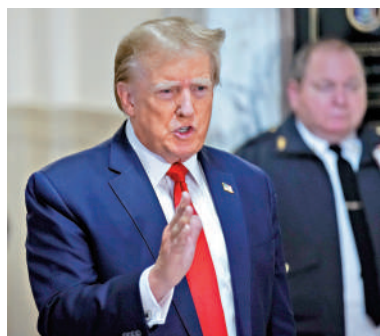
▲特朗普5日稱，重返白宮首日要當一個獨裁者。

拜登6日承認，他並非唯一能在2024年大選中擊敗特朗普的民主黨人，但他堅持參選，而非給新一代讓位。被問到是否有其他民主黨人能夠戰勝特朗普時，拜登說：「可能有50個人能做到。我不是唯一人選，但我會打敗他（特朗普）。」