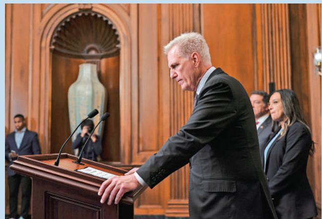
▲麥卡錫將於今年年底辭任美國國會眾議員。美聯社

【大公報訊】綜合美聯社、路透社報道：兩個多月前遭罷免的美國前眾議院議長麥卡錫6日宣布，他將不再尋求連任新一屆議員，並將於今年年底辭任眾議員。麥卡錫的離開將導致共和黨在眾議院的議席優勢進一步縮小。