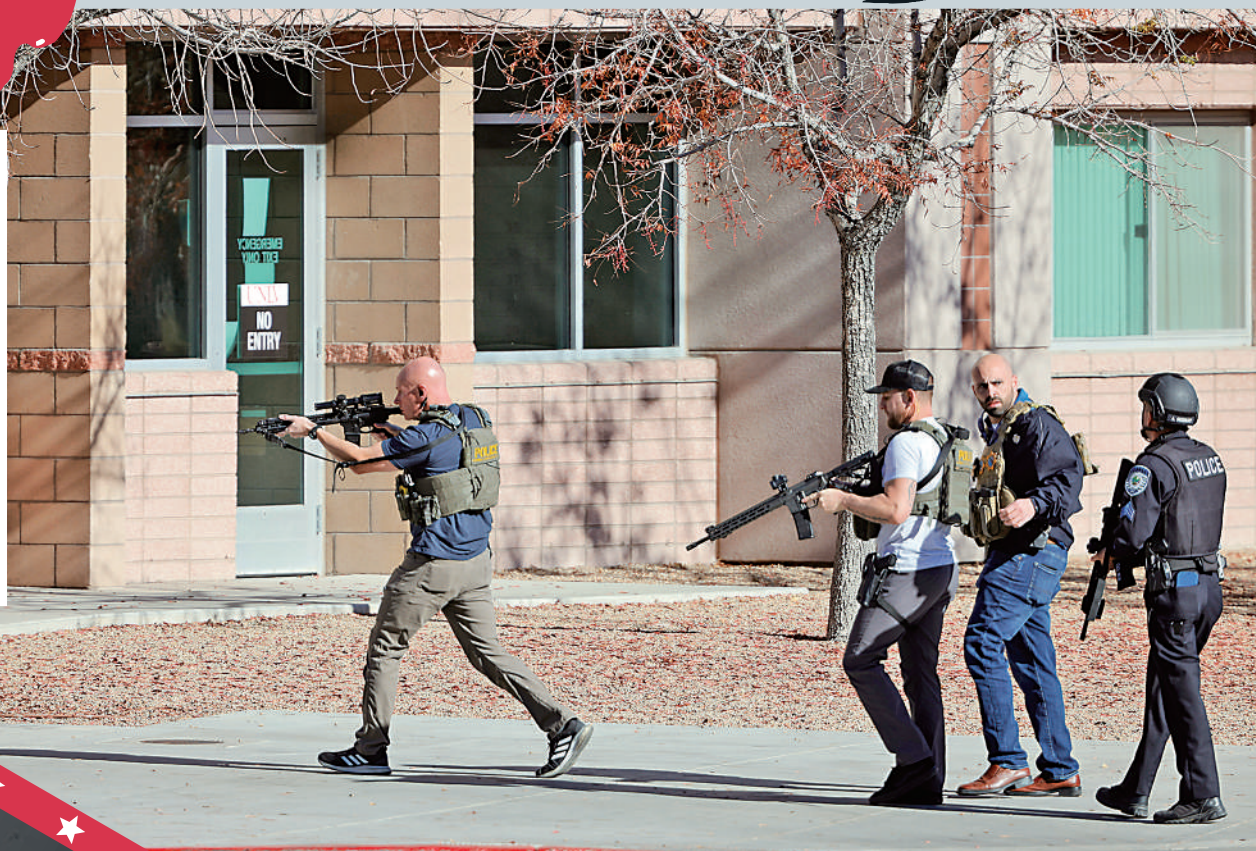
執法人員6日進入內華達大學拉斯維加斯分校，尋找槍手。

當地時間6日中午，拉斯維加斯警方接到報警，得知內華達大學拉斯維加斯分校發生槍擊案。校方在社交媒體發布緊急通知，告知師生槍手在商學院樓內，「這不是演習。逃跑，躲起來，或者反抗。」兩名校警第一時間趕到現場，與槍手交火。警方約40分鐘後宣布，槍手已被擊斃。此次事件造成包括槍手在內4人死亡，另有1人中彈受傷，目前情況穩定；4人因受到驚嚇被送醫；2名執法人員在搜尋受害者時受傷。