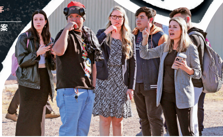
▲驚魂未定的學生們關注槍擊案後續情況。