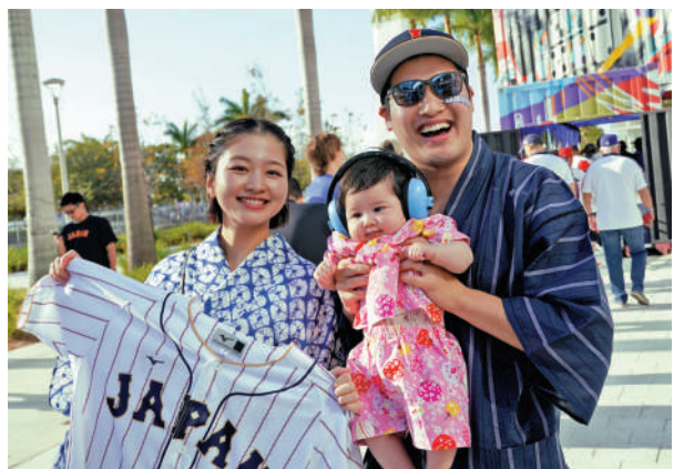
一對日本夫婦帶著小孩觀看棒球比賽。

日本全國目前約有800所大學，招生名額為62萬人，滿額率為101%。若大學招生名額維持現狀不變，2040年後，日本國內大學招生的滿額率將跌至80%左右，即使算上留學生的人數，該數字也僅為80.5%左右，將缺額2成。入學人數的減少直接威脅着大學的經營，對於授課費及學費佔收入7成的日本私立大學來說，情況格外嚴峻。目前約600所日本私立大學中，一半學校已經出現招生不滿的問題，更有三分之一的私立大學已陷入虧損狀態。按目前逐漸惡化的形式，預計越來越多的大學最終將停止招生並關門。