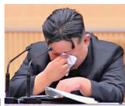
朝鮮最高領導人金正恩出席全國母親大會時落淚，並與代表握手。法新社

這是朝鮮時隔11年再次舉辦全國母親大會。1961年舉辦第一次大會時，時任最高領導人金日成曾發表講話，但第二次及第三次皆缺席。金正恩2012年出席第四次大會，但僅參與合影，而在本次大會上，他首度發表講話並提及低生育率問題，凸顯朝鮮當局對少子化問題的關注。