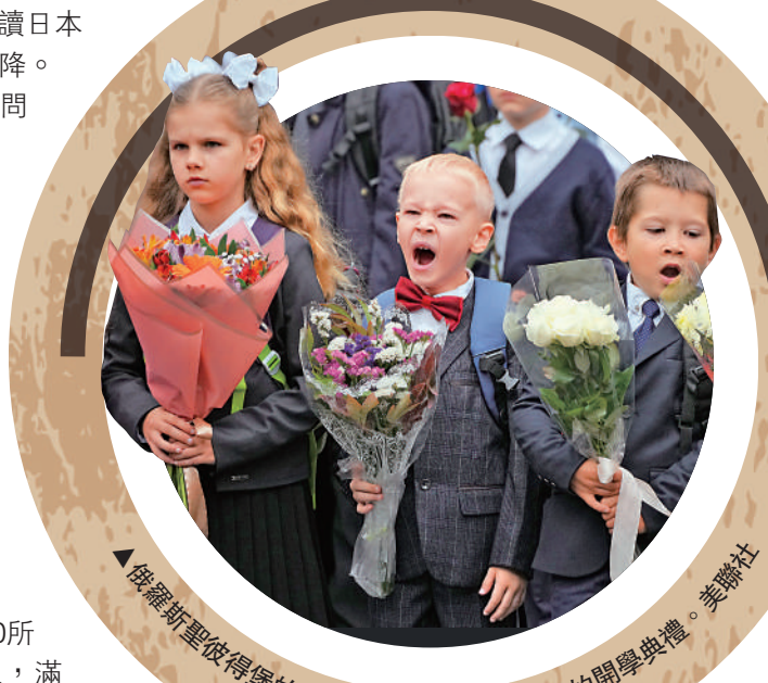
俄羅斯聖彼得堡的一級學生9月參加學校的開學典禮。

去年8月，普京宣布恢復蘇聯時期有關「英雄母親」的稱號。今年8月，普京指出，為進一步鼓勵生育、減輕育兒負擔，俄聯邦政府將啟動新的試點項目，為有孩子的家庭和單親媽媽額外設立一個社會和醫療援助系統，因為俄羅斯不能再次面臨（蘇聯剛解體時的）人口失敗。