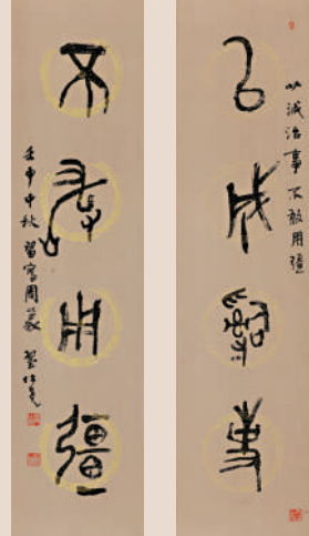
篆書四言聯 釋文： 以誠治事， 不敢用強。