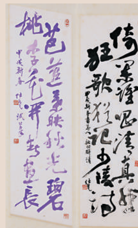
草書詩句 釋文： 倚蘭誰唱清真曲， 狂歌猶記少陵詩。 芭蕉葉映秋光碧， 桃李花開春畫長。