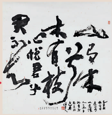
草書詩句 釋文： 山有木兮木有枝， 心悅君兮君不知。