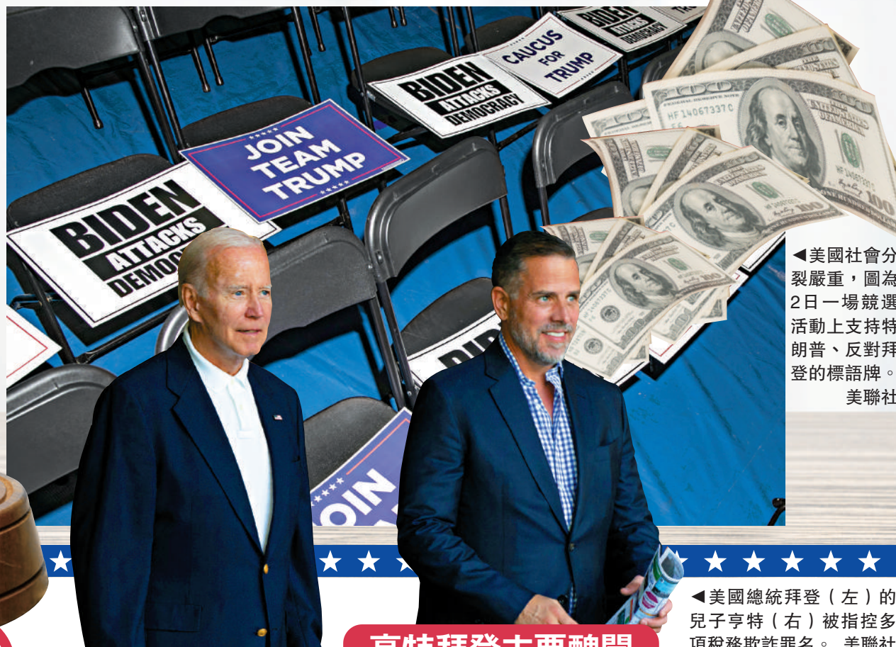
▲美國社會分裂嚴重，圖為2日一場競選活動上支持特朗普、反對拜登的標語牌。