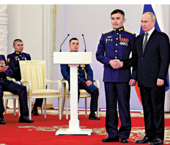
▲普京（右）8日宣布將參加明年總統大選。

普京在紀念活動上表示，成千上萬的俄羅斯人民決心與祖國同舟共濟。在與民眾會面時，他親身感受到了他們的心情，他們對團結的渴望。普京表示堅信，「我們因真