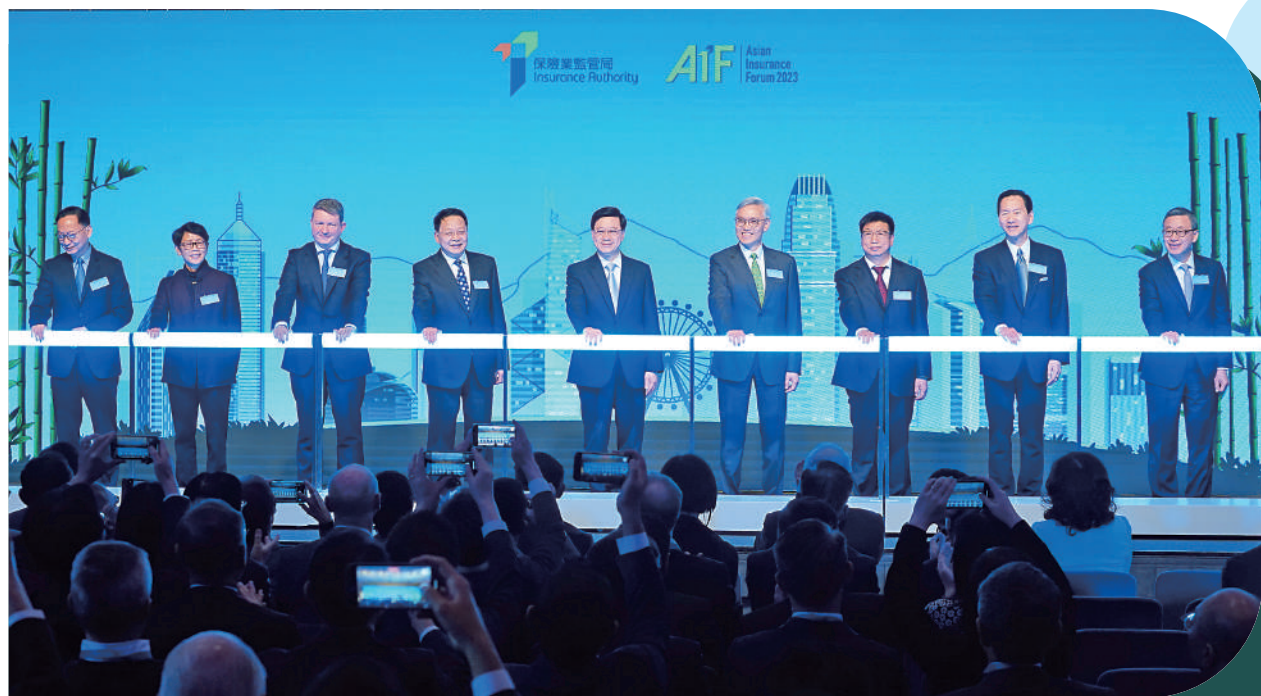
▲今年亞洲保險論壇有來自海外及本地20多位講者，以及逾千名人士參與，探討本港及亞洲保險業發展機遇。