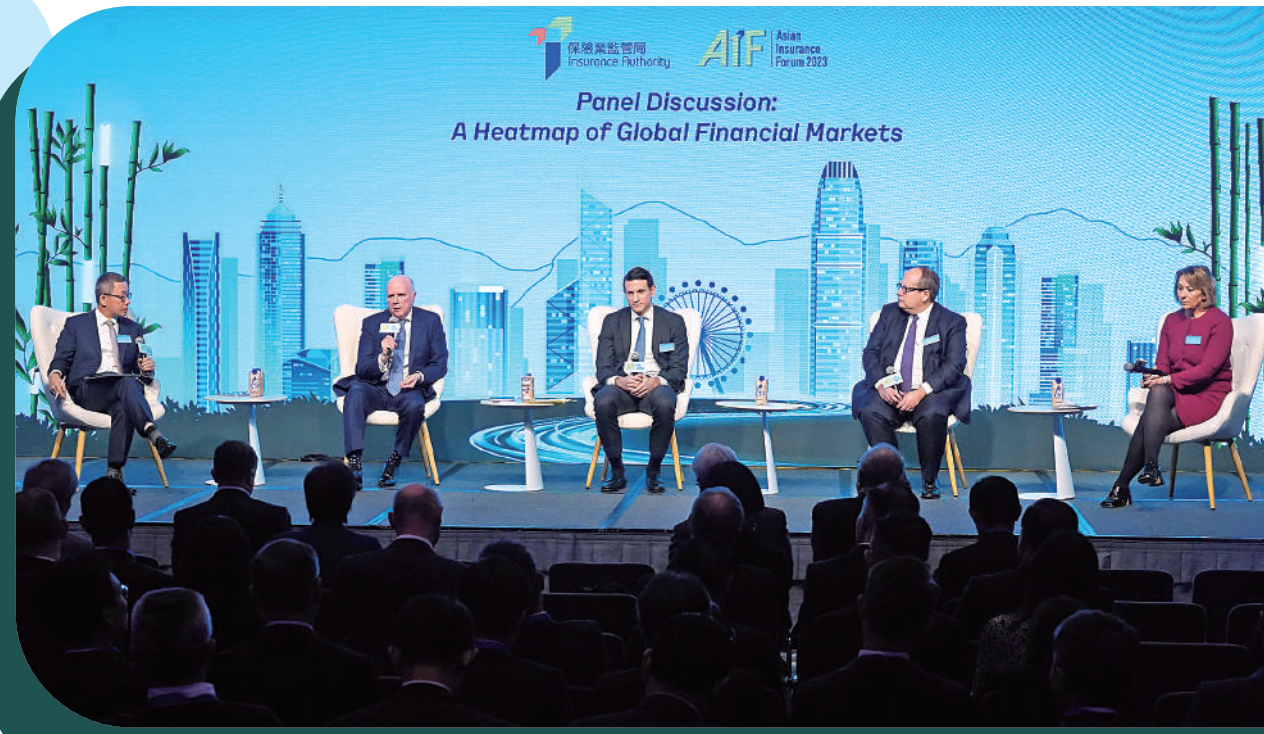
▲嘉賓們在論壇上分享保險業如何應對地緣政治風險、通脹及息率等議題。

另外，他認為，環球經濟增長前景同樣值得關注，中國2024年經濟增長料達4.6%，美國明年經濟增長料介乎1%至1.5%。美國經濟明年增長放緩是無可避免的趨勢。他又關注到，在高息環境下，美國財政狀況趨於緊張，美國政府在國防、氣候變化等開支，令到債務利息支出增加，舉例說，2021年利息支出約3000億美元，如今已增加至近7000億美元。