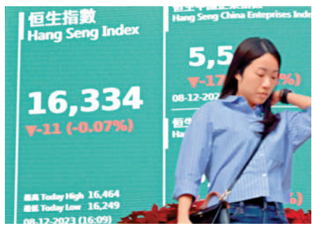
▲恒指年內累跌逾3500點，相信將出現首次連續四年下跌。