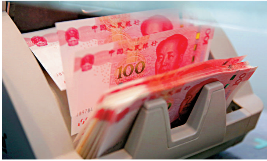
▲人民幣上月明顯反彈，但A股卻未有跟隨回升。

高達2.55%，在岸匯最新報7.1614。須注意的是，人民幣匯率9月漲勢與11月行情有所差異。9月份，人民銀行在香港市場加量續做央票，收緊離岸人民幣流動性，旨在增加海外機構沽空成本。但此舉也打壓了陸股通的投資熱情，蓋因境外人民幣融資成本大幅抬升，會促使外資機構基於資金成本考量拋售A股。儘管境外投資者持有A股市值佔比不足5%，但長期以來，內地股民將外資視作「聰明錢」的代表，認定後者掌握着更多核心信息。也因此，每當陸股通資金持續淨賣出，也會吸引散戶投資者跟隨操作，進而在市場上造成