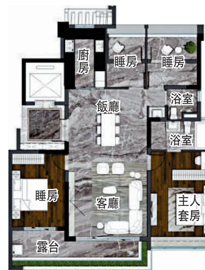
▶保利湖光悅色面積142平米四房兩廳戶型圖。