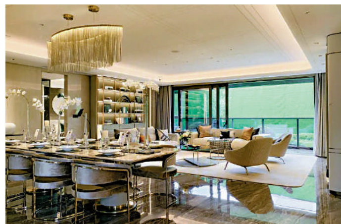
▲保利湖光悅色共提供479伙，在售戶型全向南。

儘管保利湖光悅色周邊缺乏大型商業綜合體，目前依賴附近村莊的商業街，但項目本身設有肉菜市場、少量基座商舖等，未來可滿足日常生活需求。教育資源方面，項目規劃一所幼兒園，周邊有廣州海珠華洲實驗學校、海珠春蕾實驗學校等。