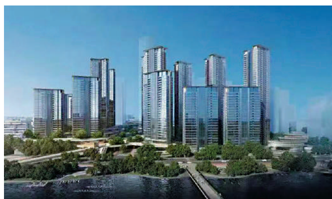
▲琶洲南TOD為集住宅、學校、商業、辦公等的大型項目。