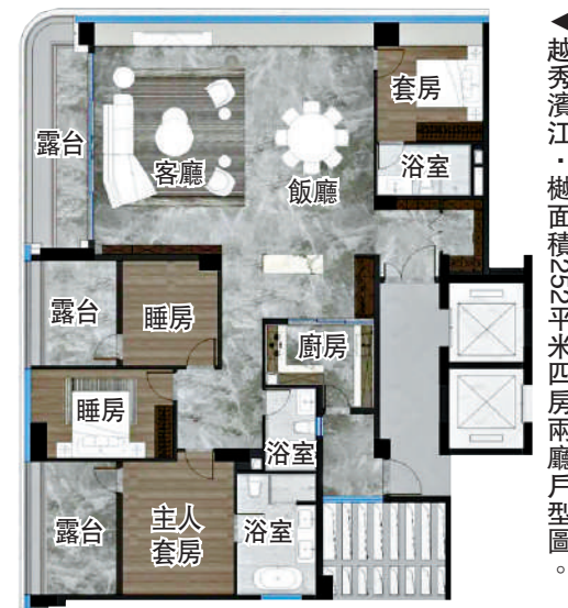
▲越秀濱江·樾面積252平米四房兩廳戶型圖。