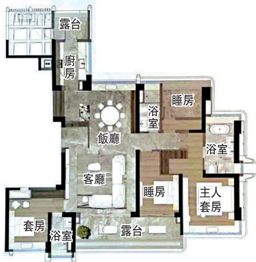
▶琶洲南TOD面積225平米四房兩廳戶型圖。