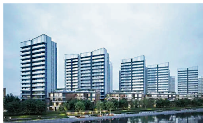
▲保利湖光悅色沿江邊而建，單位享開揚江景。