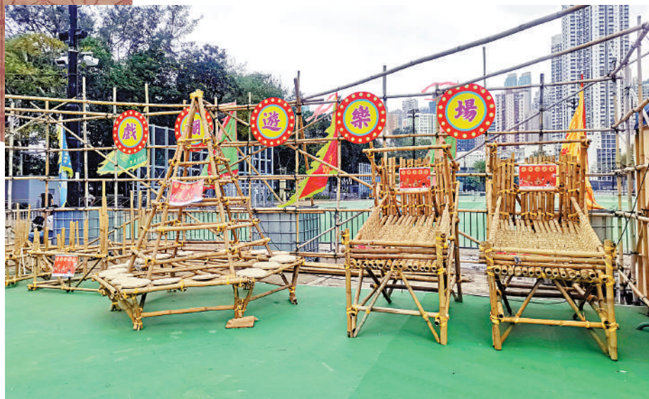
▲「戲棚遊樂場」內用竹木搭建的遊樂設施。