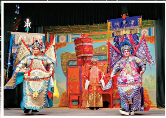
▲金龍鳳劇團在戲棚上演神功戲《六國大封相》。

提及青衣戲棚，香港研究神功戲發展的學者陳守仁關注到本地今年恢復舉辦的青衣大戲棚活動，他表示，「青衣主會出租大量攤位賣精品和熟食，現場如同元宵市場、嘉年華會，吸引了不少年輕人前去，十分成功。」關於如何阻止傳統技藝搭建戲棚消失的腳步，他提出幾點建議，例如激活已消失而具特色的台期、舉辦神功戲（需要在戲棚內上演）文化節、發動地區人士參與考察神功戲籌辦歷史等。