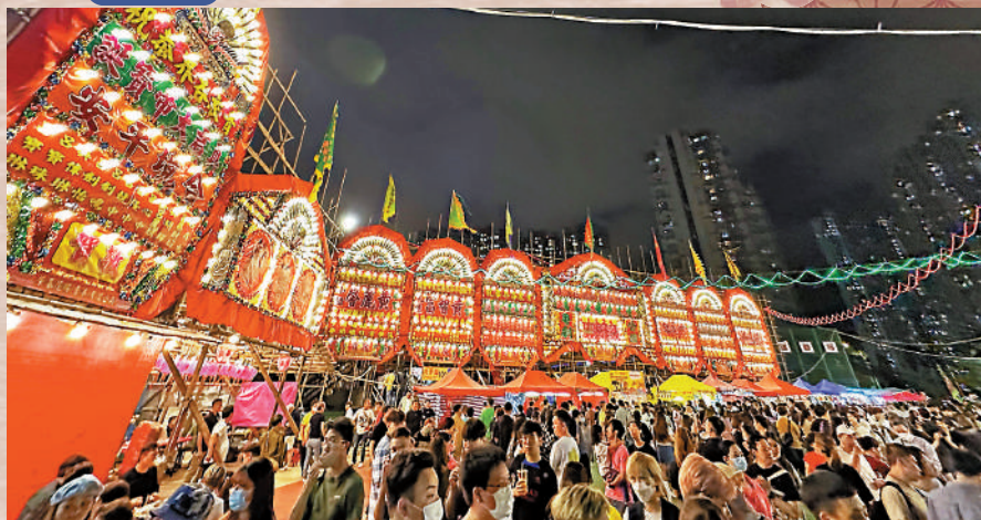
►青衣大戲棚今年復辦，周圍可見攤位。