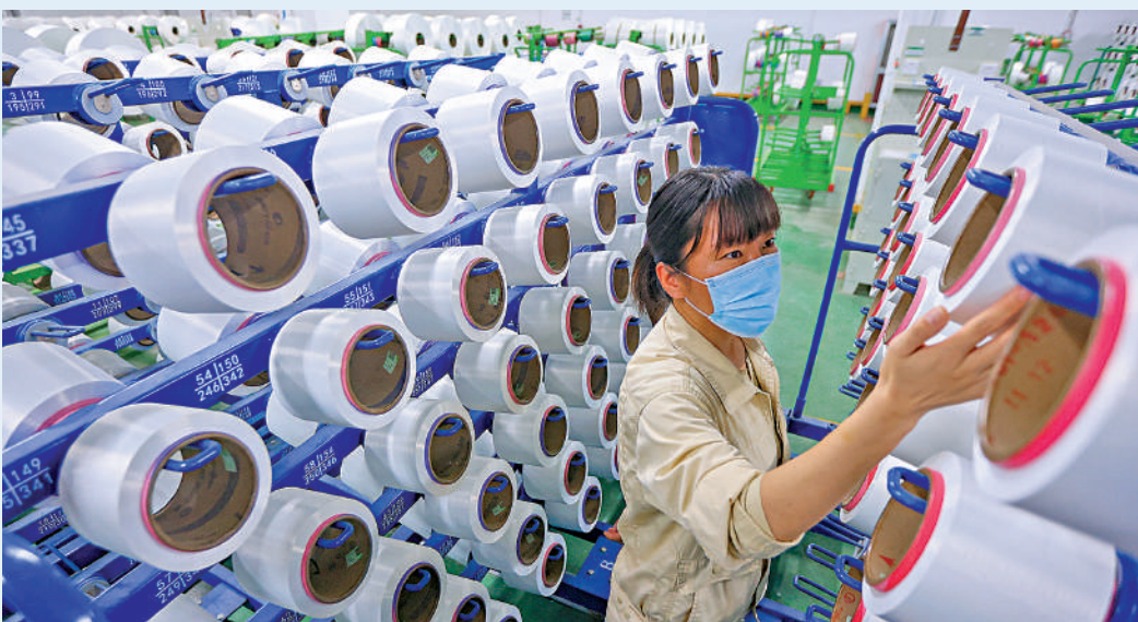
金融與實體經濟的發展應是一種良性循環的關係，金融是實體經濟發展的血脈，而實體經濟是金融發展的根基和立足點。

總體上講，明年經濟工作的重心仍然是「穩」，但「穩」的內涵也發生了一些新的變化，在「穩」字上求新突破，在「穩」字中實現經濟高質量發展，是明年經濟工作的重中之重，也是新的定位、新的定調、新的目標。因此，會議特別強調，要堅持和加強黨的全面領導，高質量落實中央對經濟工作的重大決策部署。只有高質量落實，才有高質量效率，才能高質量穩定，最終實現經濟高質量發展。