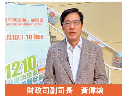
財政司副司長 黃偉綸