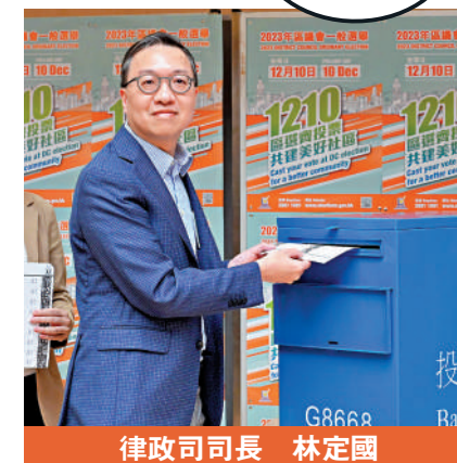
律政司司長 林定國