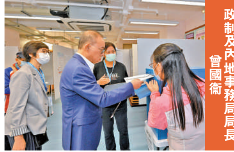
政制及內地事務局局長 曾國衛