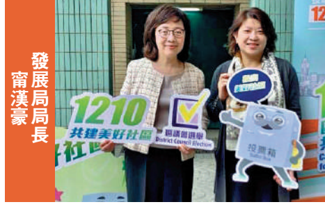
發展局局長 甯漢豪