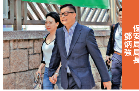
保安局局長 鄧炳強