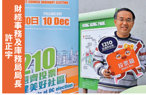
財經事務及庫務局局長 許正宇