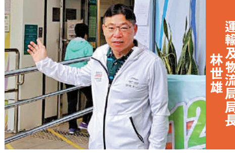
運輸及物流局局長 林世雄