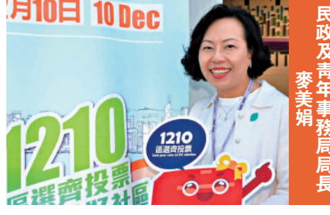
民政及青年事務局局長 麥美娟