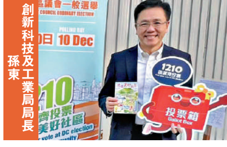
創新科技及工業局局長 孫東