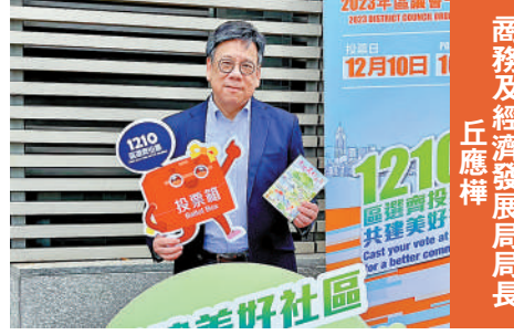
商務及經濟發展局局長 丘應樺