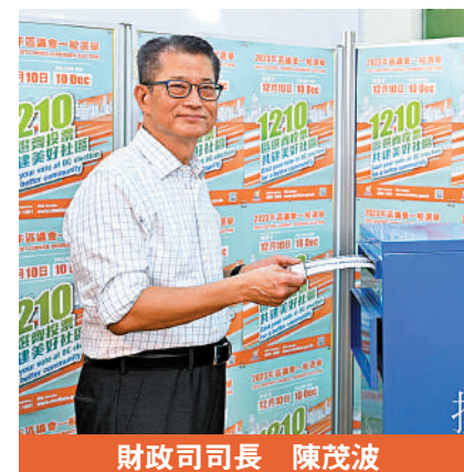
財政司司長 陳茂波