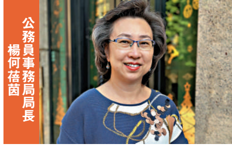
公務員事務局局長 楊何蓓茵