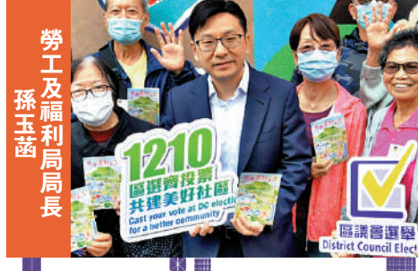
勞工及福利局局長 孫玉菫