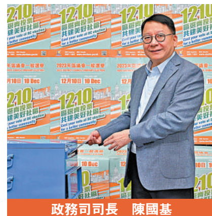
政務司司長 陳國基