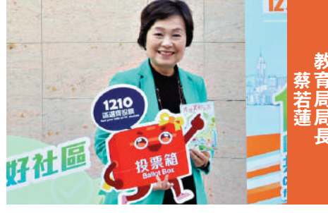
教育局局長 蔡若蓮