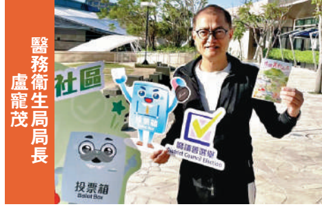
醫務衛生局局長 盧寵茂