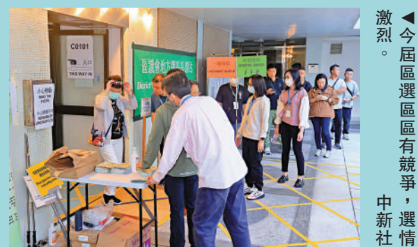
▲今屆區選區區有競爭，選情激烈。

自由黨黨魁張宇人、主席邵家輝等均表示，區議會的角色十分重要，區議員是市民與政府之間的重要橋樑，為大家反映民意，改善社區環境。此次選舉中，將分別以委任、地區委員會界別、地方選區的多渠道方式產生區議員，大大有助區議會吸納多方面聲音，實現均衡參與。