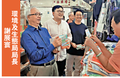
環境及生態局局長 謝展寰