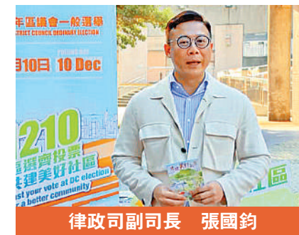
律政司副司長 張國鈞