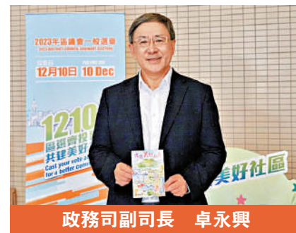
政務司副司長 卓永興