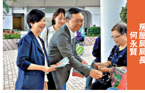
房屋局局長 何永賢