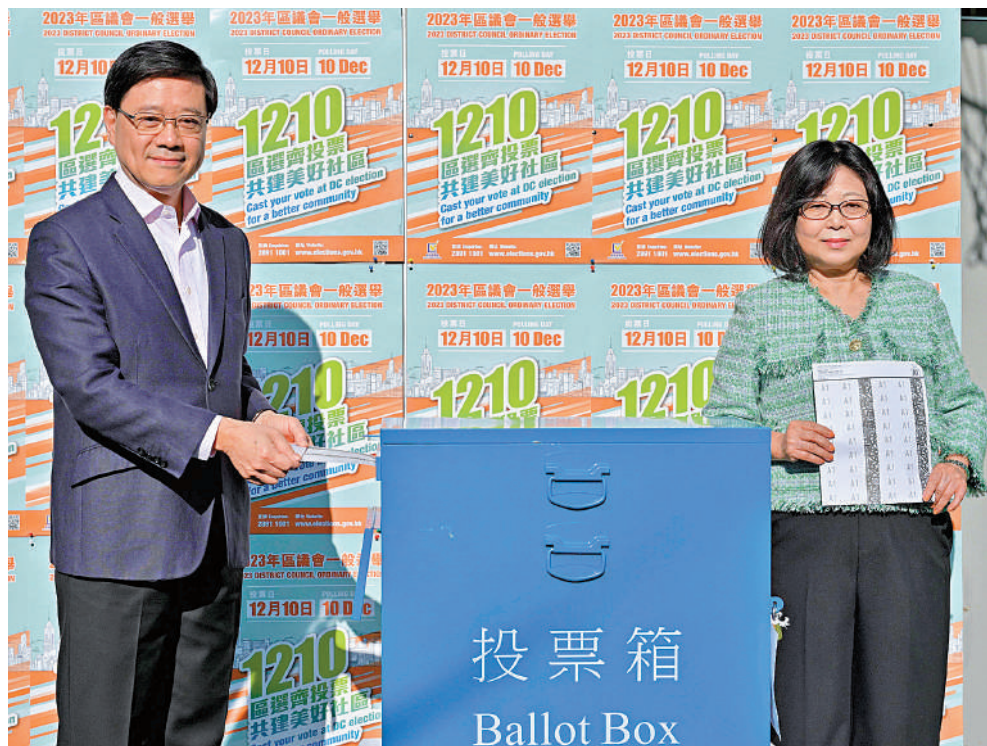
▲行政長官李家超與夫人昨日一早來到中西區高主教書院投票。