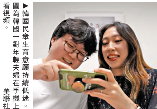
圖為韓國一對年輕夫婦在手機上看視頻。

此外，韓國新婚夫婦持有住宅比例同比降低了1.5%，許多年輕夫妻通過向銀行貸款，來支付無需月租但保證金高昂的全租房。全租房是韓國特有的一種租房模式，即租客一次性交給業主房屋價值約70%的押金，就可以免房租在此居住兩年。業主將押金存入銀行收取利息或是用於投資，待租約到期時，再將押金全數退還給租客。