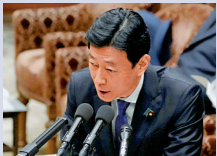
▲深陷醜聞的日本經濟產業相西村康稔。

決定「非常糟糕」，暗示背後有着政治動機，且是由於「另一派系在背後鼓動」，目的是瓦解「安倍派」。該議員還表示「永遠不會原諒（岸田）做出此決定」，並希望岸田「立即辭去首相職務」。