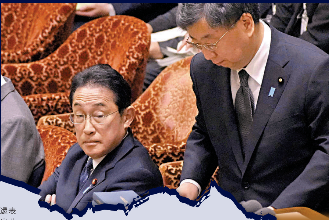
▶日本首相岸田文雄（左）8日與內閣官房長官松野博一出席眾議院會議。

【大公報訊】綜合共同社、朝日新聞網站報道：日本執政黨自民黨「安倍派」的政治獻金醜聞持續發酵，多間日媒10日透露，首相岸田文雄計劃撤換「安倍派」的所有閣員、副大臣和政務官共15人，以挽救岸田內閣屢創新低的民望。分析指，岸田文雄2021年能夠上台組閣，有賴於「安倍派」等自民黨主要派閥的支持，此番「恩將仇報」，必將激怒「安倍派」。此外，岸田內閣目前支持率持續低迷，與「安倍派」翻臉勢必導致政府更加撕裂。消息傳出後，不少日本民眾對岸田此舉並不買賬，稱「撤不撤換其實無所謂，反正換上來的人也會繼續貪腐」。