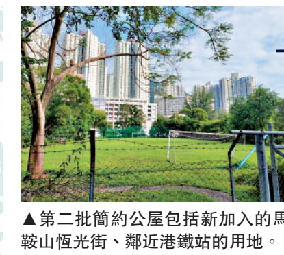
▲ 第二批簡約公屋包括新加入的馬鞍山恆光街、鄰近港鐵站的用地。