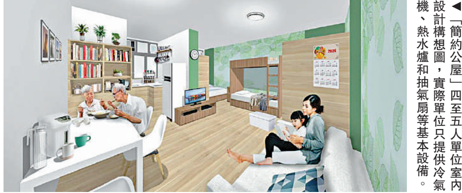
「簡約公屋」四至五人單位室內設計構想圖，實際單位只提供冷氣、熱水爐和抽氣扇等基本設備。