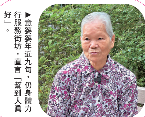
►意婆婆年近九旬，仍身體力行服務街坊，直言「幫到人真好」。

年近90歲的意婆婆雙目仍炯炯有神，可能是東涌區內最年老樓長。意婆婆約5年前由觀塘