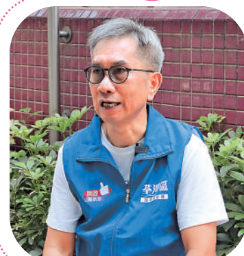
▲李先生以行動融化意見分歧的鄰里，打破彼此隔閡。

百樣人」，未必人人願意接受幫忙，並指每人的看法各有不同，各有己見，部分人因立場不同，不會和顏悅色對待，他直言相關情況屬屬正常，有些長者更會是受到子女的影響，內心雖然希望求助，卻難以開口。面對有關情況，他堅持不氣餒，「他見到你幫他，自然會知道，明白的，可能見我們做得好，都會接受我們。」他更自豪地說，近期不少街坊亦受其感染，受助的街坊不斷擴大。他同時提到樓長一人之力甚為有限，還需其他機構協助，一同協助完成。