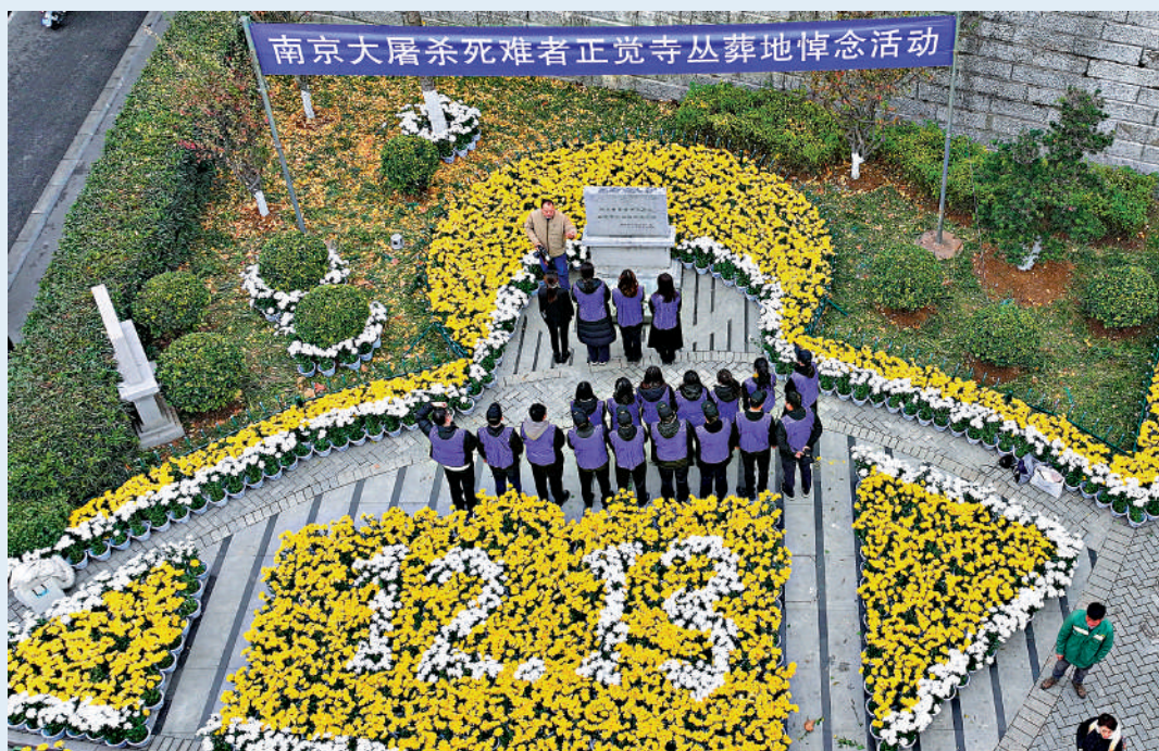
國家公祭日前夕的12日，南京大屠殺遇難同胞正覺寺叢葬地布置鮮花，民眾前來悼念。