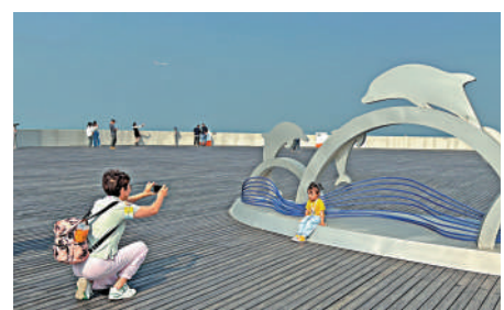
藍海豚島上設置了多處標誌性打卡點。

隨着巴士駛過海底隧道，「藍海豚島」正式亮相。站在藍海豚島的觀景平臺上，遊客即可遠眺香港國際機場和大嶼山，將大灣區「海陸空」壯景統統收眼底，收穫僅此一份的觀景體驗。在島上，人們可以親眼感受全球最繁忙機場之一的香港國際機場的忙碌景象。