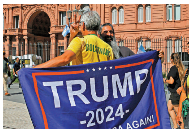
▲ 特朗普的支持者10日出現在阿根廷總統米萊的就職典禮上。

另據NBC和狄家紀事報所做的最新民調顯示，特朗普在愛荷華州有壓倒性的支持。在初選可能會投票的艾奧瓦民眾裏，有51%支持特朗普，比位居第二的佛州州長德桑提斯足足領先了32%，第三是16%的前美國駐聯合國大使黑莉。