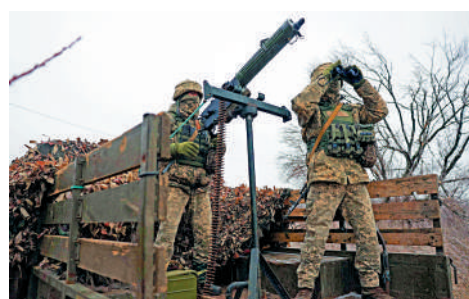
▲ 烏克蘭士兵10日在頓涅茨克地區的陣地上偵察。

澤連斯基於當地時間11日抵達華盛頓，並於12日在華盛頓與美國總統拜登舉行會晤。澤連斯基當天還向參議院發表講話，並同美國眾議院議長約翰遜進行私人