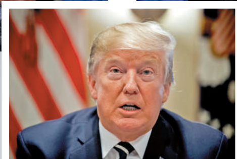
▲ 特朗普多宗官司纏身，但他在多個搖擺州支持率領先。

涉嫌干預2020年大選案是特朗普當前面臨的4起刑事訴訟之一。特朗普在此案中被控4項罪名，包括共謀欺詐國家、串謀妨礙官方程序、妨礙或企圖妨礙正式程序，以及陰謀侵犯權利。美國華盛頓聯邦地區法院法官塔尼亞·丘特坎今年8月將此案的審判日期定於2024年3月4日。