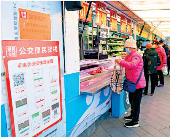
保障農民工工資按時足額發放，關心困難群眾生產生活，深入落實安全生產責任制，守護好人民群眾生命財產安全和身體健康。

會議強調，切實保障和改善民生。要堅持盡力而為、量力而行，兜住、兜準、兜牢民生底線。更加突出就業優先導向，確保重點群體就業穩定。織密紮牢社會保障網，健全分層分類的社會救助體系。加快完善生育支持政策體系，發展銀髮經濟，推動人口高質量發展。 會議要求，要做好歲末年初重要民生商品保供穩價，