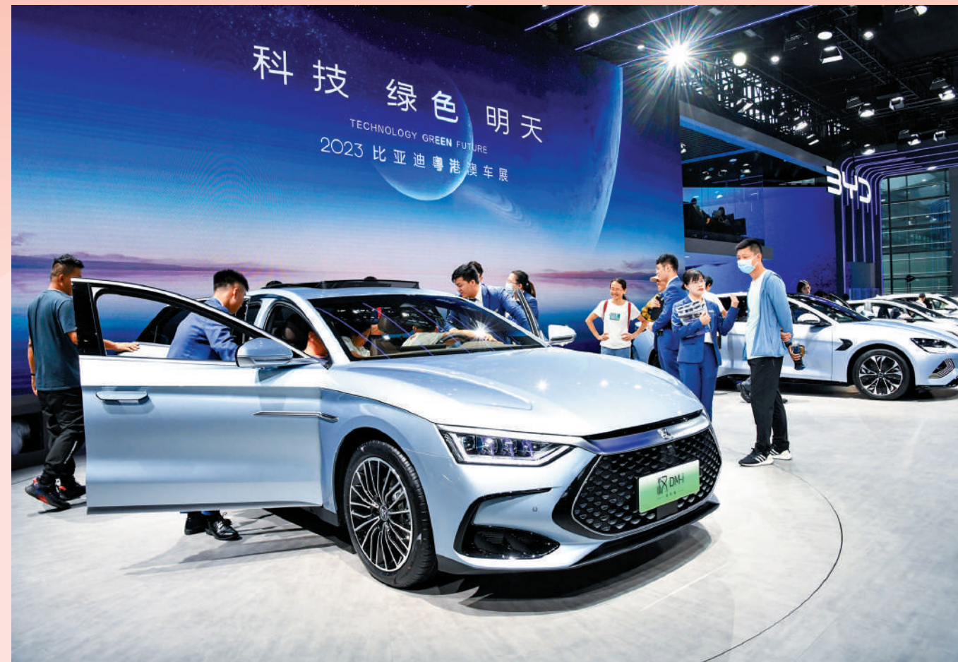
▲中央經濟工作會議強調着力擴大國內需求。圖為觀眾在2023粵港澳大灣區車展比亞迪展台了解新能源汽車。