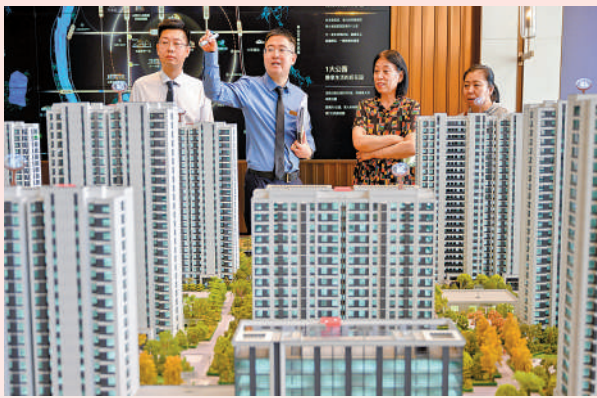
▲山西太原一售樓部銷售人員為民眾推介商品房。

積極穩妥化解房地產風險方面，會議給出了三大具體路徑。首先，要一視同仁滿足不同所有制房地產企業的合理融資需求；其次，要加快推進「三大工程」；最後，要完善相關基礎性制度，加快構建房地產發展新模式。