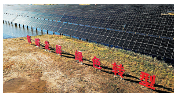
▲企業轉用可再生能源，有助降低營運成本。