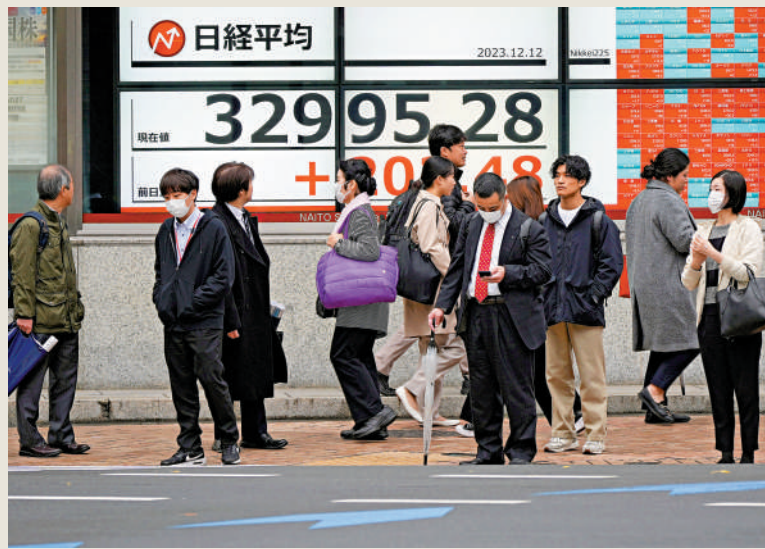
▲日本民眾對岸田內閣深感失望。美聯社 ▶岸田文雄（中）14日撤換內閣成員，包括官房長官松野博一（右）。美聯社

【大公報訊】綜合共同社、彭博社、路透社報道：日本執政黨自由民主黨政治獻金醜聞持續發酵，在野黨立憲民主黨13日向眾議院提交了針對岸田內閣的不信任決議案。雖然由於自民黨及其盟友公明黨佔據多數席位，不信任案未能通過，但岸田內閣的民調支持率已跌至22.5%，接近「下台水域」。日本首相岸田文雄13日晚召開記者會，對此次醜聞引起民眾質疑表示「遺憾」，並宣布將於14日撤換涉事內閣成員。有分析指出，這種「棄車保帥」的策略並不能解決岸田和自民黨面臨的危機。