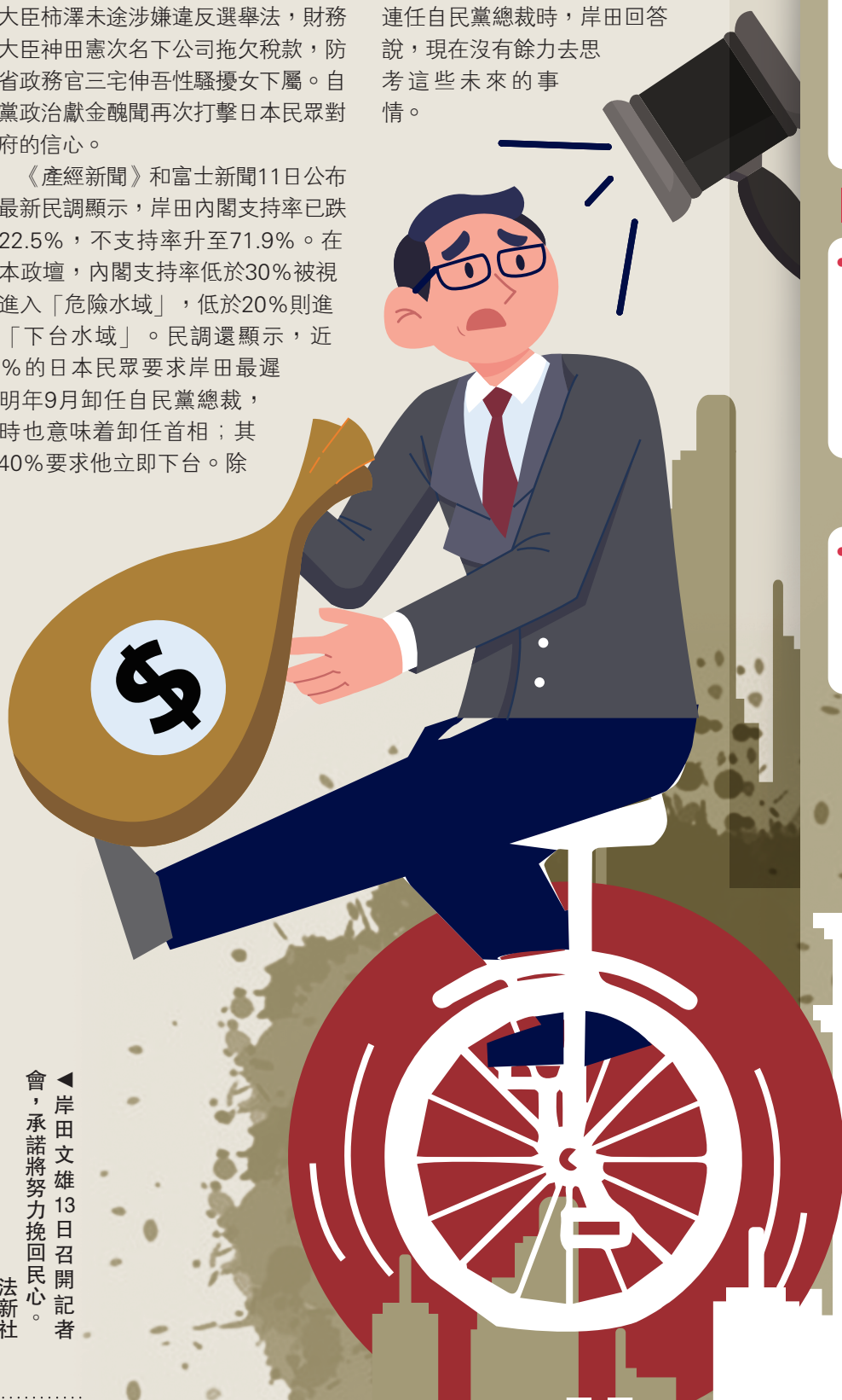
▲岸田文雄13日召開記者會，承諾將努力挽回民心。

13日被問到是否計劃在本月稍晚通過2024年度中央政府總預算案之後內閣總辭，以及是否考慮尋求連任自民黨總裁時，岸田回答說，現在沒有餘力去思考這些未來的事情。