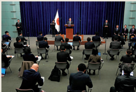
▲岸田文雄13日召開記者會，承諾將努力挽回民心。

的。多名自民黨成員表示，岸田無意辭職。報道指出，在現行機制下，權力集中於首相官邸，如果岸田意志堅決，很難促成首相更替。另外，東京地檢特搜部針對政治獻金醜聞的調查將持續至明年，若岸田在調查尚未結束時下台，自民黨政權將不可避免地被削弱，新首相將被迫接過「燙手山芋」。一名前內閣成員稱，如今的局面令人警惕，自民黨的支持率恐繼續下降。