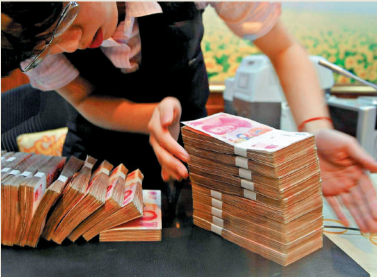
▲中國經濟保持穩步恢復態勢，今年11個月的新增信貸總量已超過去年全年。

中國人民銀行昨日發布的數據顯示，人民幣新增信貸從10月的7384億元（人民幣，下同）增至11月的1.09萬億元，環比大增47%，但同比仍少增1368億元或11.15%。社融規模增量從10月的1.85萬億元增至11月的2.45萬億元，同比多增4556億元或22.84%。今年首11個月，人民幣新增信貸、社融規模增量分別為21.58萬億元、33.65萬億元，同比分別多增1.55萬億元和2.79萬億元。 分析稱，上月新增信貸略遜去年同期，但今年11個月的信貸總量已超去年全年，表明信貸數據不弱，且從分項指標看，信貸結構持續優化。