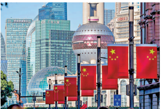
▲在中國經濟復甦帶動下，今年世界經濟增長保持良好態勢。

惠譽將今年全球經濟增長預測從2.5%上調至2.9%，其中美國上調0.4個百分點至2.4%，中國上調0.5個百分點至5.3%。惠譽還將除中國外的新興市場增長率上調0.2個百分點至3.6%。該行預期，今年中國經濟重啟的提振將不會重現，預計明年經濟增速放緩至4.6%。