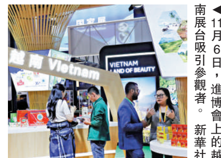
◀11月6日，進博會上的越南展位吸引參觀者。新華社

雙方能夠本着相互信任、相互尊重的精神妥善處理，力爭推進海上共同開發，共同維護好地區和平穩定。這些重要共識豐富了中越全面戰略合作夥伴關係的內涵，將為構建中越命運共同體提供更堅實的物質基礎。中越在各自現代化征程上相互支持、攜手共進，意味著亞洲現代化開闢出新前景，必將為世界各國實現現代化作出新貢獻。新華社