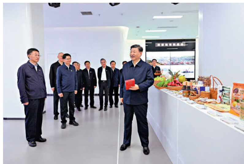
◀12月14日上午，習近平總書記在廣西南寧市考察調研。這是習近平在良慶區蟠龍社區考察調研。新華社