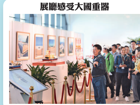
展廳感受大國重器