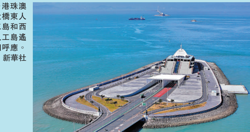
▶港珠澳大橋東人工島和西人工島遙相呼應。新華社