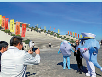
▲遊客在藍海豚島上與海豚人偶合影留念。

記者15日登上首度對外開放的「藍海豚島」。東鄰香港大嶼山及香港機場，向南是浩瀚的大海，也是眾多遊客「追捧」的中華白海豚自然保護區；向西則是距離約6公里的白海豚島，兩島間巨輪來往穿梭，配以北邊的珠海高樓林立的城市風景，組成浩瀚海上圖景。「目前，門店內本月底『港珠澳大橋遊』相關產品已預訂完。」珠海陽光國際旅行社有關負責人透露，「大橋遊+珠海半日遊」、「大橋遊+香港一日遊」等產品也熱銷，預訂組團已排到下個月。廣之旅方面也透露，目前12月17日、21日、23日出發的「港珠澳1日遊」均已滿團。大公報記者方俊明