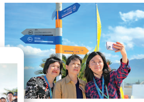
島上漫步打卡留念