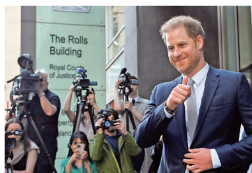
▲哈里王子6月時以證人身份出庭。

哈里王子稱，從1996年開始，他成為鏡報集團鎖定目標長達15年，集團旗下報紙刊登的140多篇報道都是非法收集資料的結果。他此次提交