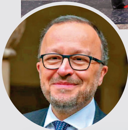
▲大英博物館副館長威廉姆斯。網絡圖片