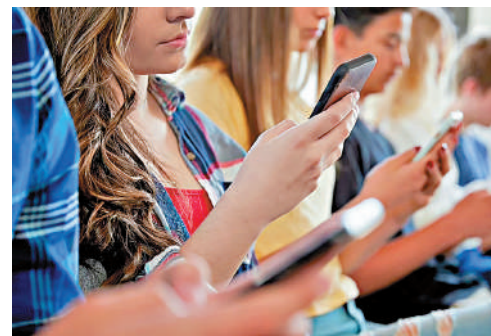
▲英國有大量青少年沉迷於社交媒體。