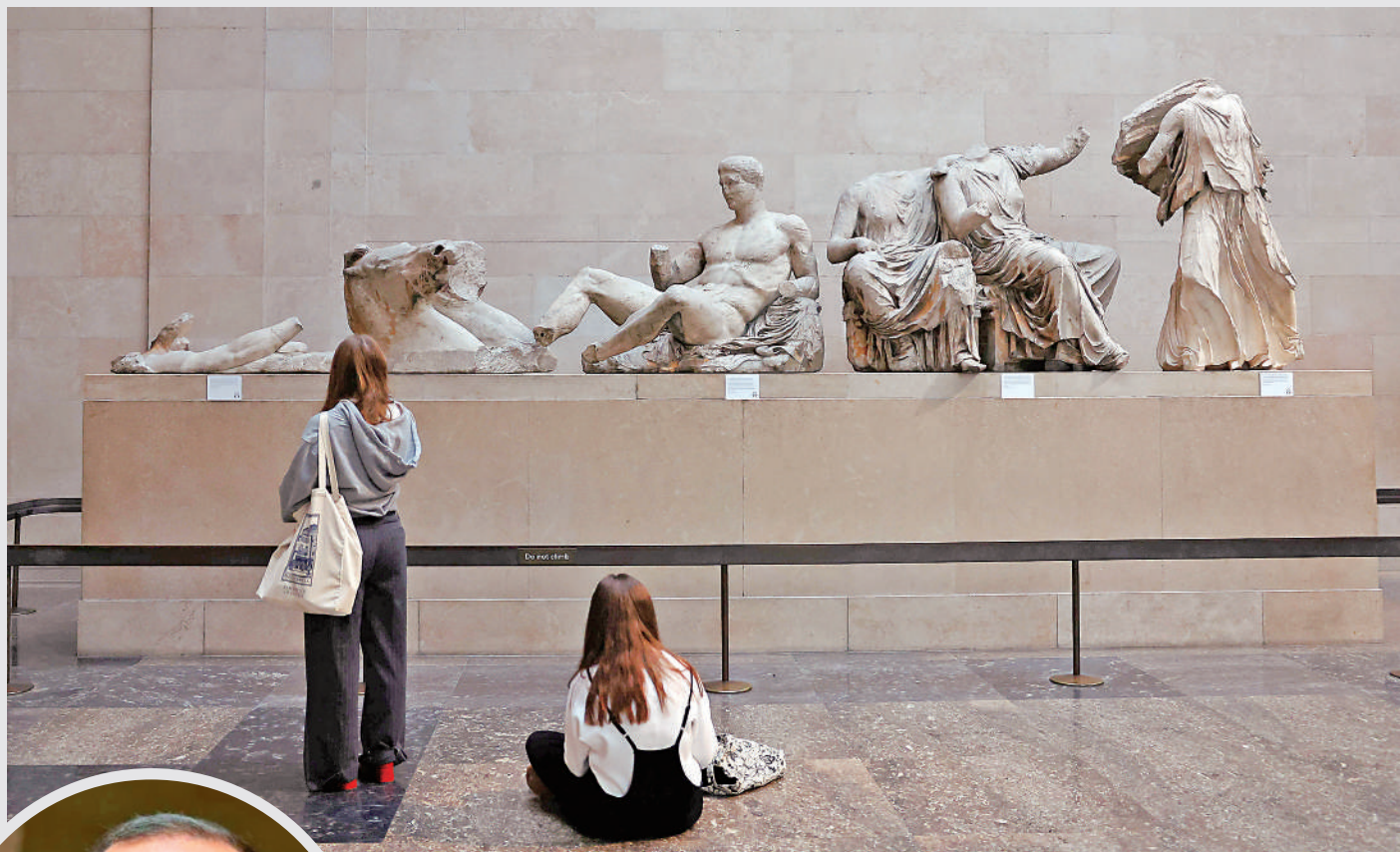
▲大英博物館展出希臘的帕特農神廟石雕。

希臘總理米佐塔基斯上月26日訪問英國，原本計劃與英國首相蘇納克會晤時要求英國將帕特農神廟雕塑歸還給希臘。但蘇納克在兩人會面前數小時突然取消會晤，引發希臘方面不滿。蘇納克的一位發言人還表示，並沒有歸還這些雕塑的計劃。