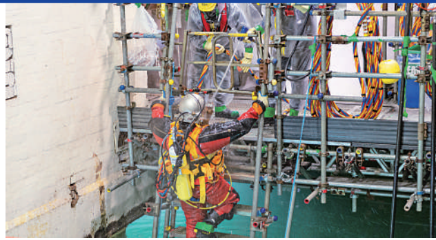
◀塞拉非爾德工作人員被迫忍受「有毒的職場文化」。