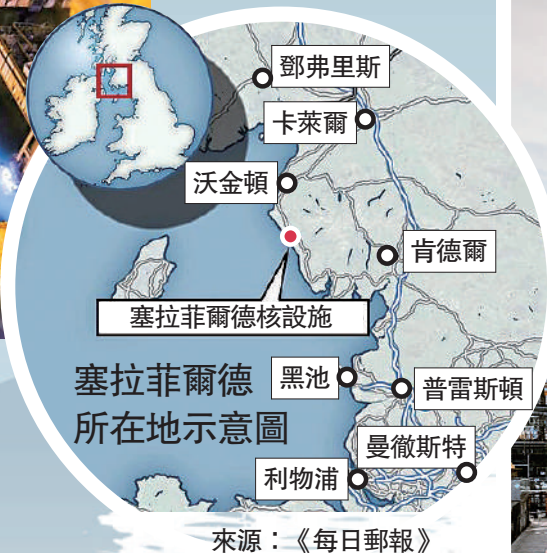
►塞拉非爾德的核廢料儲存庫過去3年多持續洩漏。網絡圖片