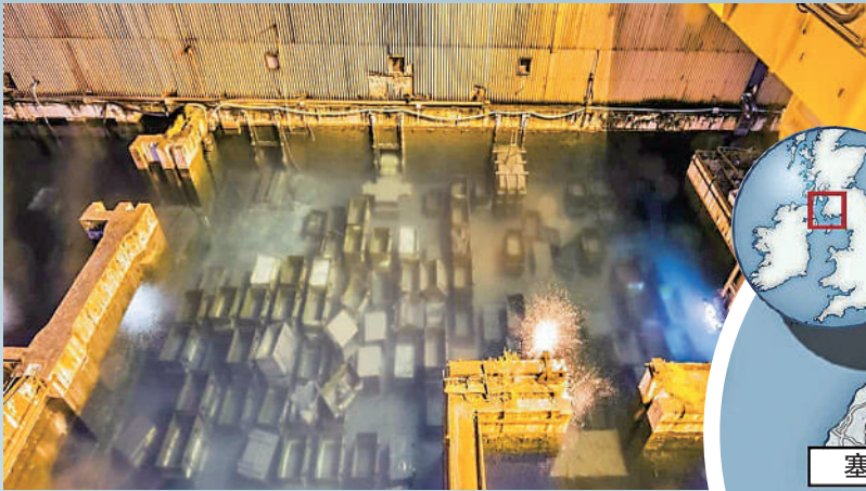
▲「B30」污水池材料老化嚴重，表面出現裂痕，隨時可能發生核洩漏事故。網絡圖片