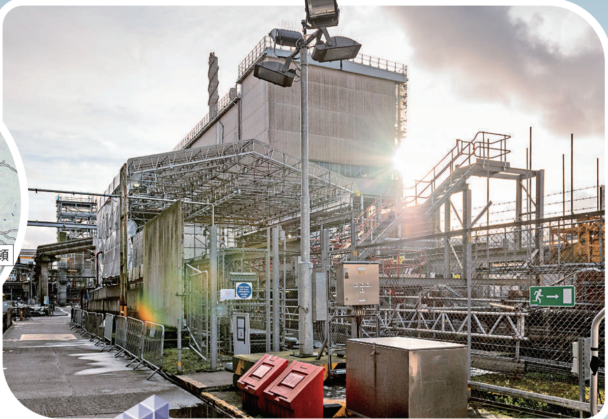
▼塞拉非爾德內部存在大量安全隱患。