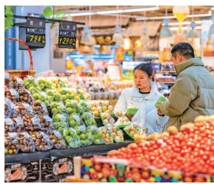
▲12月9日，消費者在貴州省一家超市選購水果。

「經濟運行總體恢復尤其是需求持續恢復，有助於改善物價低位運行狀況。」劉愛華稱，隨着擴大內需政策的逐步落實見效，消費將逐步從疫後恢復轉向持續擴大，當前經濟運行中存在的有效需求不足問題有望得到逐步緩解，價格低位運行狀況也會得到改善，中國經濟不會出現通貨緊縮。