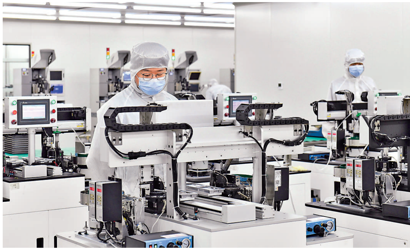
◀國家統計局發布數據顯示，11月國民經濟持續回升向好，工業生產恢復加快。圖為在山東省一高新技術產業開發區，員工生產濾波器。

11月份，工業生產恢復加快，服務業較快增長。全國規模以上工業增加值同比增長6.6%，比上月加快2個百分點，為今年以來新高。全國服務業生產指數同比增長9.3%，比上月加快1.6個百分點。市場銷售增勢較好，社會消費品零售總額42505億元，同比增長10.1%，比上月加快2.5個百分點，為今年5月以來新高。