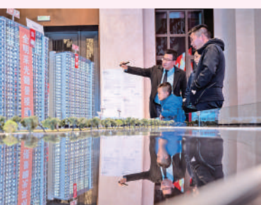
▲11月4日，山西省一售樓部舉行「雙十一購房節」活動。

根據國家統計局發布的數據，11月，內地70個大中城市商品住宅交易規模有所上升，銷售價格環比總體延續降勢、同比有漲有降。其中，各線城市二手住宅銷售價格環比、同比均呈降