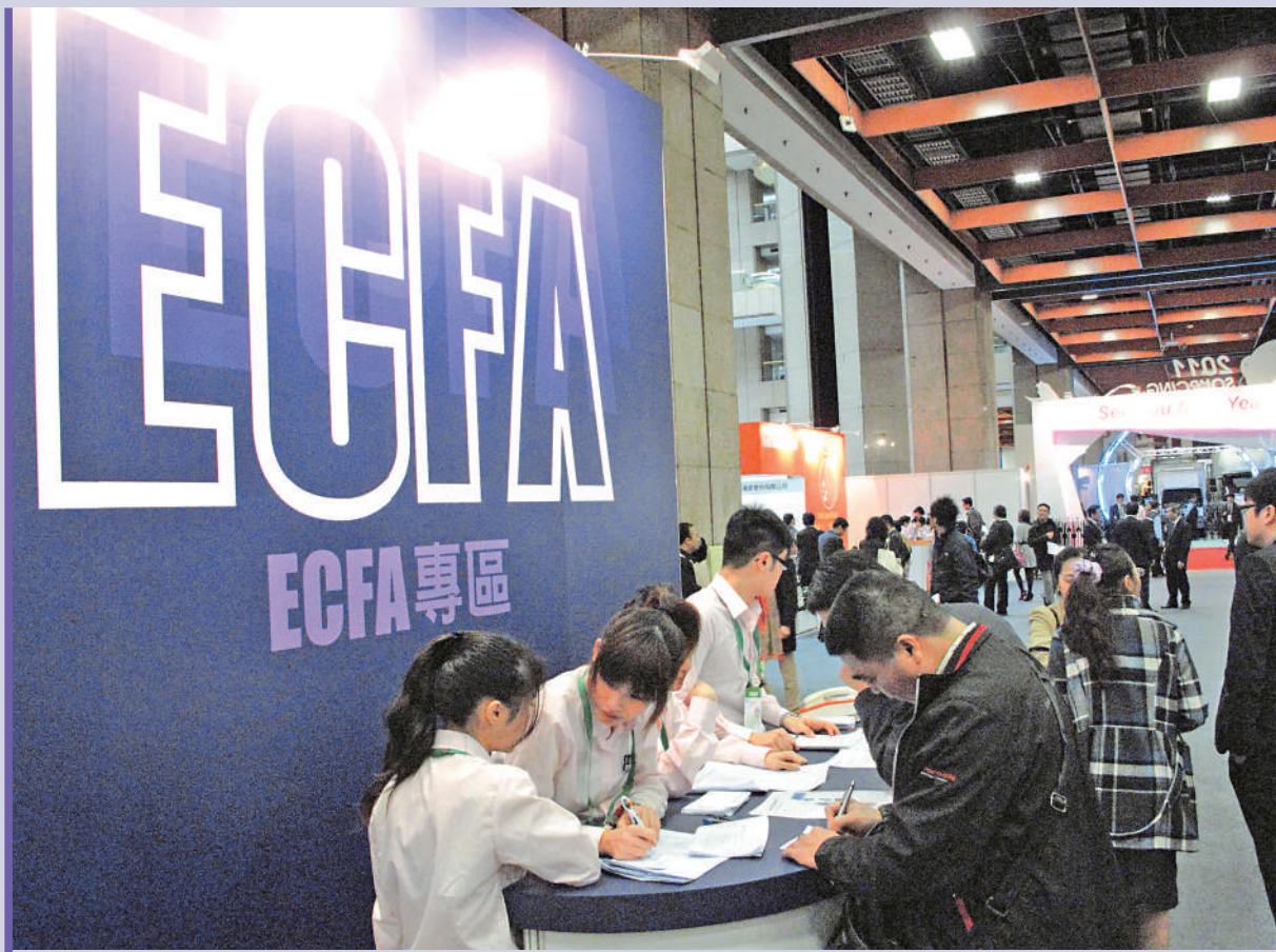
▲商務部15日發布公告，認定台灣地區對大陸貿易限制措施構成貿易壁壘。調查顯示，台灣地區對大陸長期採取貿易限制措施，截至2023年11月共對大陸2509項產品禁止進口。

▲第十二屆海峽兩岸機械產業博覽會11月8日在福建龍巖舉行，台灣機械展區吸引參觀者。