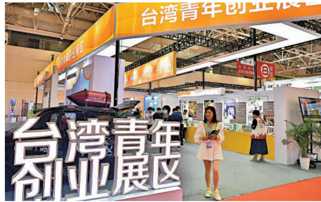
▲今年5月舉辦的海峽兩岸經貿交易會上，台灣青年創業發展區受關注。

該官員指出，今年因疫情影響更甚，還有部分工作者恢復戶籍，預計統計人數還會較去年再增加。