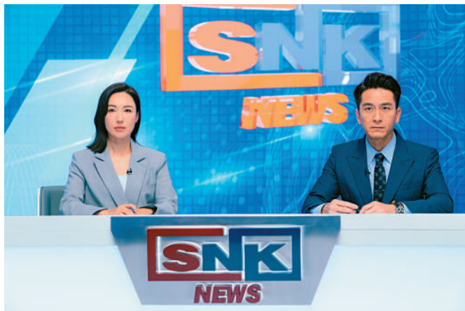
▲《新聞女王》一劇以新聞主播的職業入題。

TVB台慶劇《新聞女王》現正於翡翠台播出，光是最初的五集，三個新聞事件，劇情不斷反轉，豆瓣評分一度高達8.2，讓人直呼一個「爽」字，更有網民形容「要是港劇這麼拍，不愁沒人看」。然而，也有觀眾甚至新聞同行看劇後，半讚半彈。細品《新聞女王》的劇情，確實有一些可圈可點的地方。