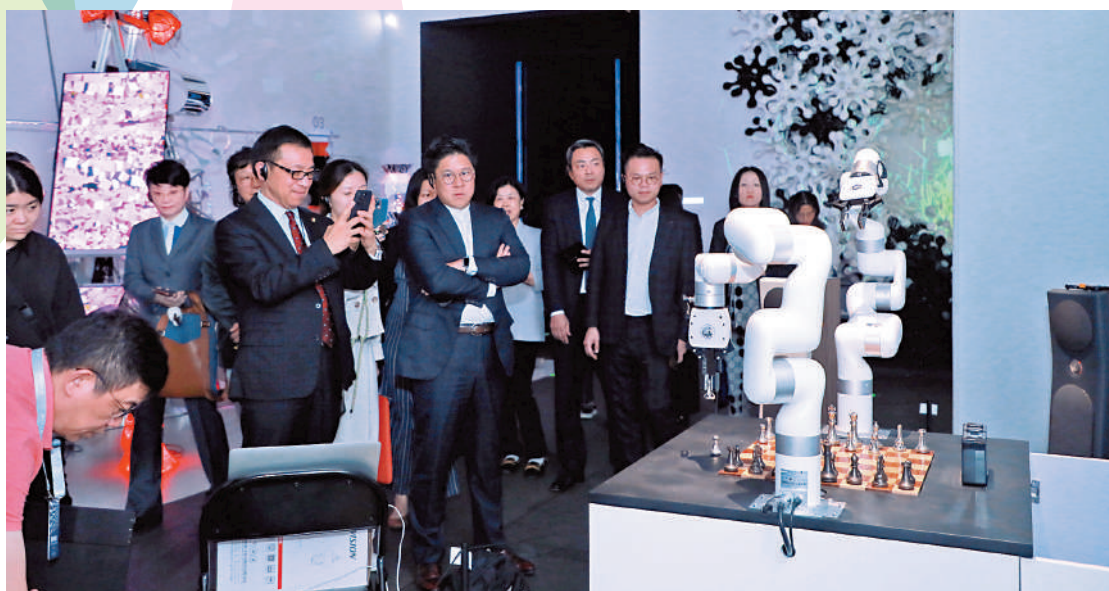
香港藝術發展局交流團到訪深圳美術館。