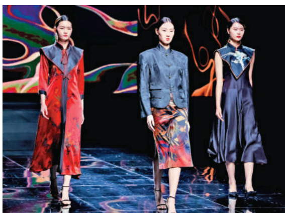
「香雲紗」時裝別具嶺南特色。

首日，交流團到訪香雲紗非遺文化園和南沙民心港人子弟學校參觀。在南沙橫核鎮參觀香雲紗非遺文化園時，眾人皆感嘆南沙香雲紗製作技藝之