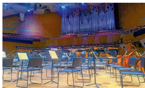
星海音樂廳內一景。