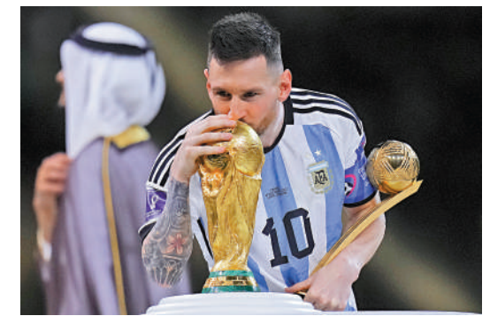
美斯在2022年世界盃上奪得冠軍。

1987年出生的美斯在10歲時的身高僅有1.25米，比同齡孩童矮小不少，他於11歲時確診患上俗稱「侏儒症」的生長激素缺乏症。該症狀患者