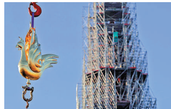
16日，巴黎聖母院塔尖換上金色公雞風向標。

法國總統馬克龍8日表示，巴黎聖母院將於2024年12月8日如期重新對宗教活動及公眾開放。不過重新開放並不代表修復工程竣工，竣工預計要到2029-2030年。按照計劃，大教堂明年12月重新開放後，將可接待年均1400萬遊客，比火災前多200萬。