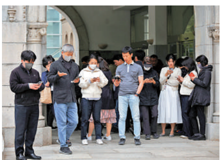
▲韓國人婚育意願下降。圖為午休時段自願自玩手機的韓國上班族。

多塞特警告指，韓國的案例表明，眾多發達國家面臨的低生育率問題可能以更快的速度惡化。近年日本、新加坡、德國等紛紛通過提高新生兒補貼等方式鼓勵生育，韓國亦於今年初將一歲以下兒童父母每月領取的補助金額從30萬韓圓增加至70萬韓圓（約4200港幣元），明年還將再次上漲到100萬韓圓（約6000港幣元）。