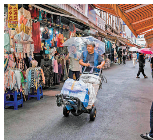
▲受少子化影響，韓國本土勞動力減少。圖為在首爾市場送貨的工人。法新社

在同一時間內，由於出生率下降，韓國本土勞動人口將大幅減少至1667萬人，意味著外國人佔比提高至36.7%。換言之，50年後韓國每3名適齡勞動人口中就有1名外國人。韓媒稱，隨着外籍勞動人口佔比增加，其就業範圍將不再局限於韓國人不願意從事的建築和造船等行業，而將擴大至社會各個領域。韓國僱傭勞動部上月底已宣布，為解決勞動力短缺問題，明年將引進16.5萬名非專業移民工人，創歷史新高。