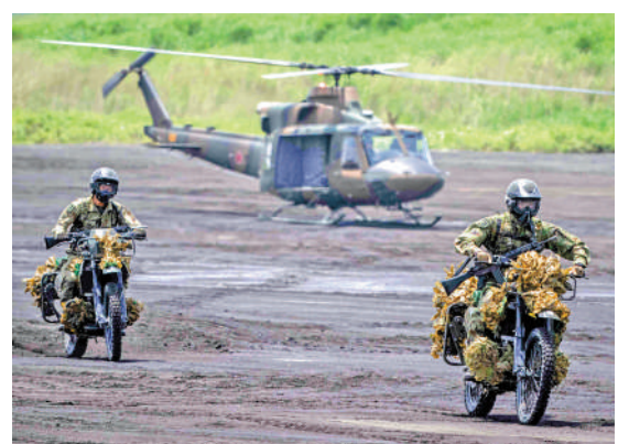
▲日本政府計劃大幅增加防衛費。圖為日本自衛隊今年5月進行演習。

至65.4%創新高；77.2%的受訪者認為，自民黨「沒有」或「不太具備」查明政治獻金醜聞的自淨能力。《日本經濟新聞》和東京電視台共同進行的民調顯示，三分之二的日本民眾認為岸田應當為此次醜聞負責。