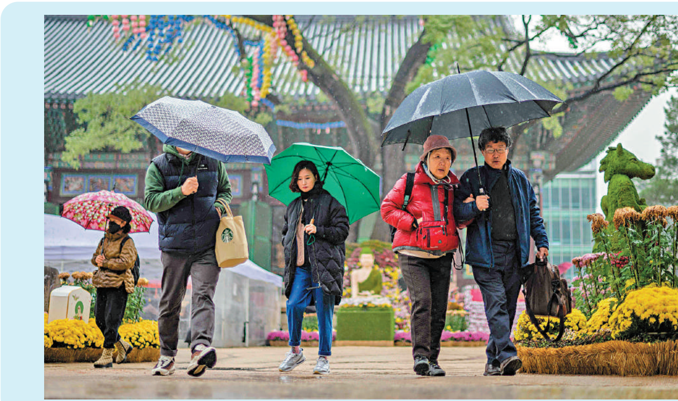
▲韓國面臨嚴重的少子化和老齡化問題。