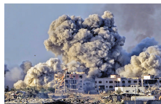
▲以軍16日轟炸加沙地帶。

法國外交部一名工作人員13日在以軍對加沙南部拉法的轟炸中受傷，最終不治身亡。法國外交部16日發表聲明，要求以色列盡快對此事進行全面調查。