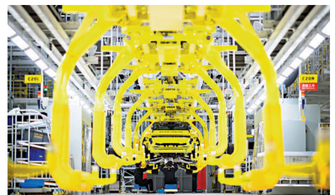
▲位於湖北省武漢市經工區智能網球場和電動汽車產業園的路特斯全球智能工廠，工人在流水線上作業。

始終居於首位。堅持黨的領導，是我國改革開放取得成功的基本政治保證，是貫徹改革全過程的政治主線。新征程上繼續推進全面深化改革，必須始終堅持和加強黨的領導，堅持志不改、道不變，沿着完善和發展中國特色社會主義制度、推進國家治理體系和治理能力現代化的目標任務堅定不移走下去。