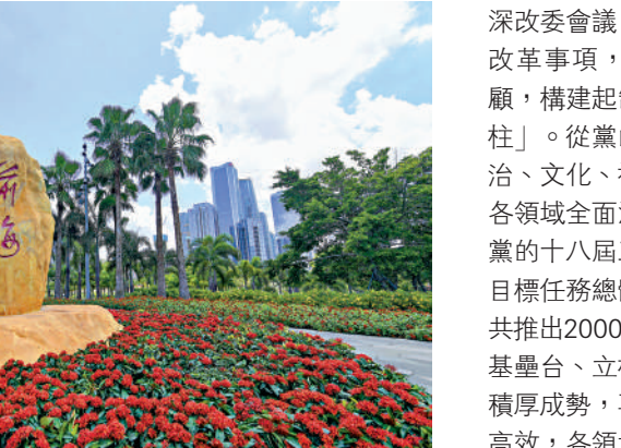
▲在廣東省深圳市前海拍攝的前海石。

偉大變革，蘊含思想偉力。無論是中央全面深化改革領導小組，還是改革後的中央全面深化改革委員會，習近平總書記都親自領銜，把改革的總體設計、統籌協調、整體推進、督促落實抓在手中。權威人士透露，總書記認真審閱重大改革方案的每一稿，逐字逐句親筆修改。黨的十八大以來，習近平總書記主持召開70次中央深改領導小組和中央深改委會議，部署了一系列重大改革事項，點面結合、統籌兼顧，構建起制度建設的「四樞八柱」。從黨的建設，到經濟、政治、文化、社會、生態文明……各領域全面深化改革風生水起，黨的十八屆三中全會提出的改革目標任務總體如期完成，各方面共推出2000多個改革方案。從夯實基盤、立住樑柱到全面推進、積厚成勢，再到系統集成、協同高效，各領域基礎性制度框架基本確立，中國特色社會主義制度更加成熟更加定型，國家治理體