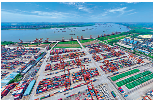
▲武漢漢陽邏港一期碼頭。

習近平總書記指出，我們推進改革要堅持頂層設計和基層探索相統一，對重大改革要堅持試點先行，取得經驗後再推廣。