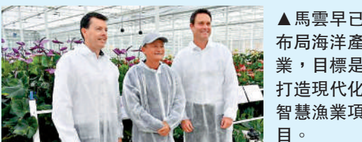
▲馬雲早已布局海洋產業，目標是打造現代化智慧漁業項目。 ▲馬雲（中）退休後周遊列國，考察農業科技。