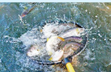
▲「一米八」率先推出兩款海產包括貽貝及大黃魚，目前透過盒馬渠道出售。