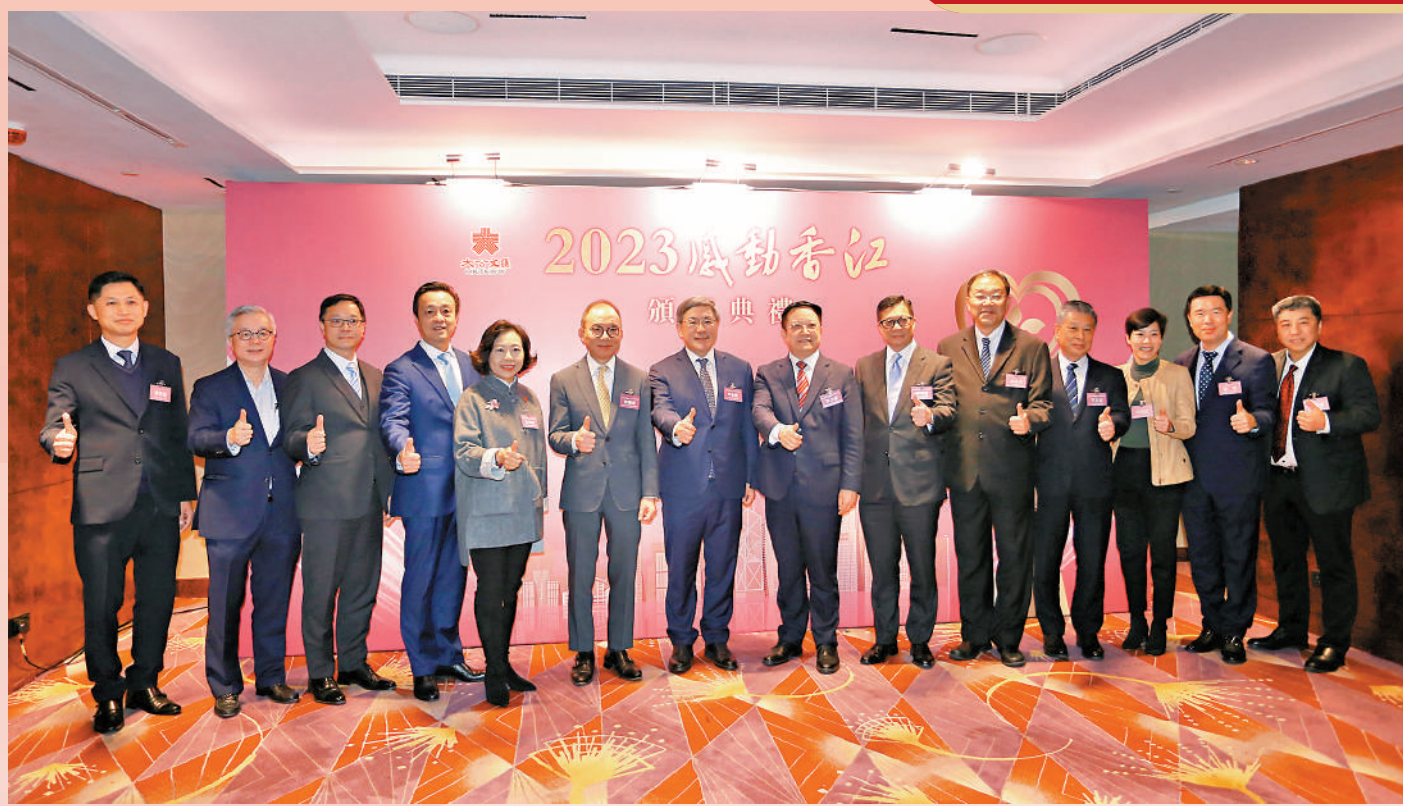
▲由香港大公文匯傳媒集團主辦，中央政府駐港聯絡辦青年工作部擔任特別支持機構的「2023感動香江」頒獎典禮昨日隆重舉行，一眾嘉賓合照留念。