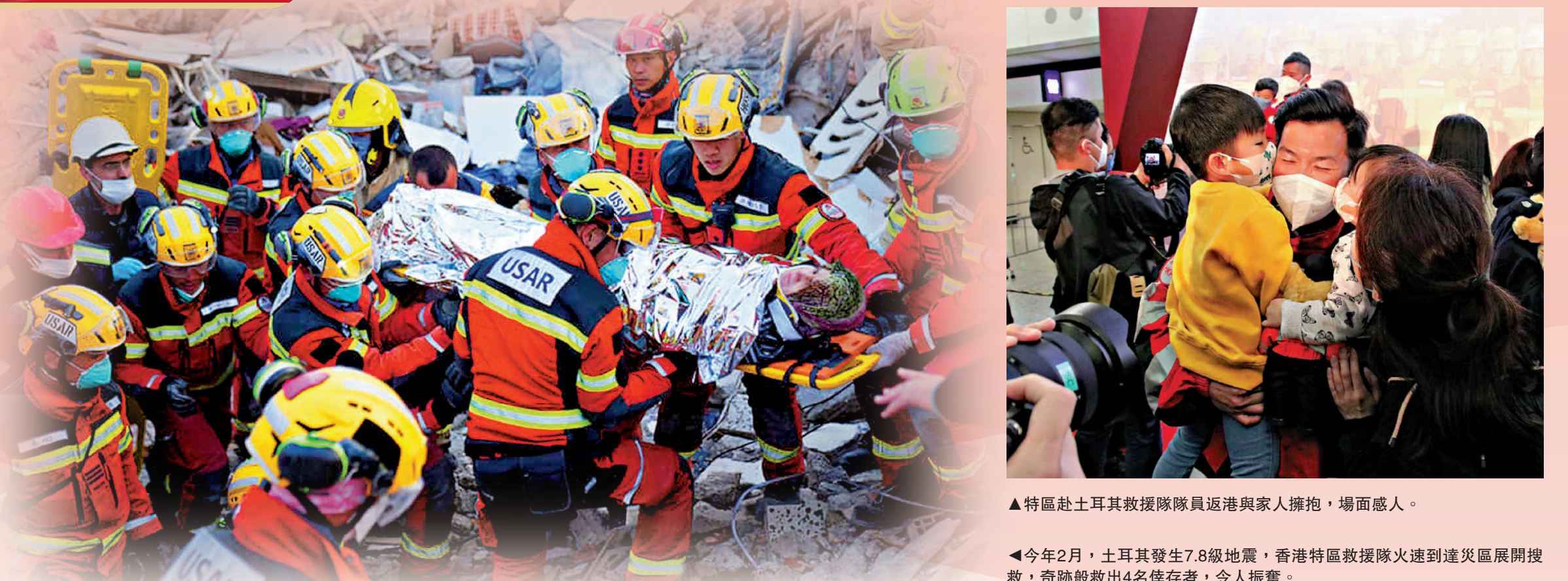
▲特區赴土耳其救援隊員返港與家人擁抱，場面感人。