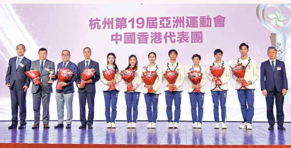
▲杭州亞運會中國香港代表團奮力拼搏，刷新歷來最佳成績。

杭州第19屆亞運會上，中國香港代表團奪得8金16銀29銅共53面獎牌，刷新中國香港代表團史上最佳成績。代表團成員表示，本次杭州亞運會增添了不少競技項目，他們以運動員的身份踏上這一趟奇妙且振奮人心的旅程，奮力拚搏，突破自我，收穫了滿意的成績與一面面獎牌。成員們表示，感謝祖國人民在亞運現場的鼓勵與喝彩，香港市民對運動員們的支持與認可，在現場辛勤工作的亞運會志願者，以及港協暨奧委會為運動員們提供的後勤保障服務。