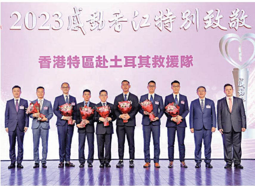
▲香港特區赴土耳其救援隊到地震災區奮戰，昨日獲頒「2023感動香江特別致敬」獎。