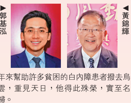
▲黃錦輝年來幫助許多貧困的白內障患者撥去烏雲，重見天日，他得此殊榮，實至名歸。

為香港發展貢獻努力。新地亦藉此恭賀獲獎的團體和人士，他們無私奉獻、負重前行的情操令人深感敬佩，值得各界學習。」另外，立法會議員黃錦輝在社交媒體發文，表示出席了「2023感動香江評選活動」並擔任主禮嘉賓。他恭喜立法會議員同僚林順潮教授獲頒「感動香江人物」獎項。黃錦輝表示，林議員多