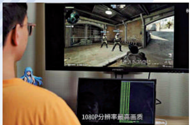
▲有視頻博主拍攝了在網絡遊戲中試用「AI外掛」的影片。

遊戲官方一旦發現使用外掛作弊的違規賬號，最高封停10年，而且使用外掛登錄的機器也會同時被封禁。