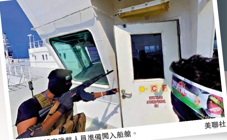
▲持槍的胡塞武裝人員準備闖入船艙。