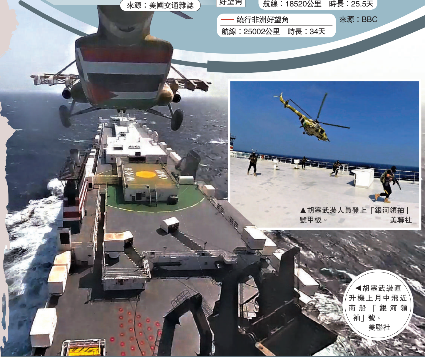
▲胡塞武裝人員登上「銀河領袖」號甲板。

胡塞武裝最高政治委員會成員穆罕默德當天表示，美國試圖同胡塞武裝建立渠道進行溝通，但胡塞武裝拒絕同美國溝通，「和美國溝通讓我們臉上無光」。另一名也門胡塞武裝高級官員宣布，針對紅海航行船隻的襲擊不會停止。