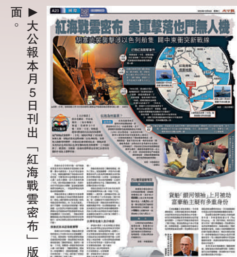
大公報本月5日刊出「紅海戰雲密布」版

隨着胡塞武裝頻繁襲擊行經紅海的商船，地中海航運公司、法國達飛海運集團、馬士基集團、赫伯羅特公司等航運巨頭陸續宣布，暫停所有集裝箱船在紅海及附近海域航行。英國石油公司（BP）18日亦宣布跟進，暫停紅海航運。另外，香港東方海外貨櫃航運公司、台灣長榮海運等也暫停紅海的航運。 大公報整理