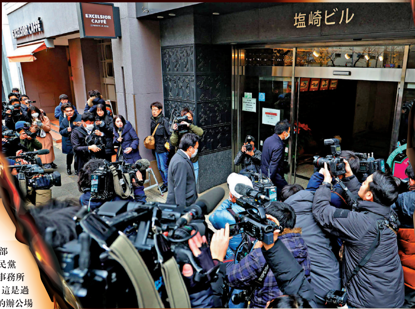
▲特搜部檢察官19日前往自民黨「二階派」事務所。法新社

【大公報訊】綜合共同社、NHK、法新社報道：日本自民黨黑金醜聞持續發酵。19日，東京地方檢察廳特別搜查部（東京地檢特搜部）對自民黨「安倍派」和「二階派」的事務所分別進行了強制入室搜查。這是過去19年來首次有自民黨派閥的辦公場所被搜查。「安倍派」和「二階派」瞞報出售政治籌款派對券獲得的收入，並將這部分黑金發給議員作為回扣，涉嫌違反《政治資金規正法》。日本首相岸田文雄就此事向國民致歉。專家認為，隨着檢方調查的深入，此次醜聞一旦發展成刑事事件，岸田內閣倒台並非沒有可能。