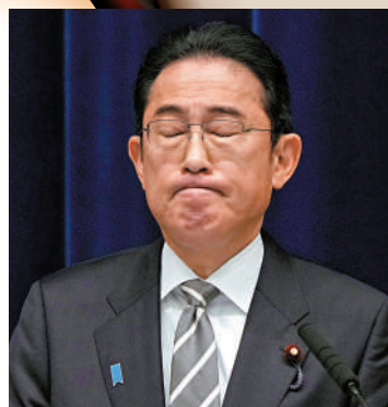
▲岸田文雄支持率暴跌，執政前景暗淡。法新社

有分析指，日本檢察系統與前首相安倍晉三早在2020年就結下樑子，特搜部此次矛頭直指「安倍派」，可能與此有關。2020年初，時任首相安倍晉三試圖讓自己的心腹黑川弘務接任總檢察長一職。當時黑川已經63歲，即將退休，安倍特意修改了規定，在內閣會議上宣布將黑川的退休時間延後。檢察系統和在野黨均表示不滿，並指責內閣干預檢察事務。但同年5月，日媒揭露黑