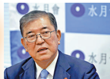
▲日本民眾支持無派閥政客石破茂出任首相。資料圖片

岸田內閣原本獲得「岸田派」、「麻生派」和「茂木派」支持，並在政策和人事安排上向最大派閥「安倍派」妥協，以維持政權穩定。但黑金醜聞爆發後，岸田清洗了內閣中大部分「安倍派」成員，引起該派閥不滿。如今五大派閥均捲入醜聞，東京地檢特搜部已開始強制搜查派閥辦公室，料將對自民黨總裁選舉造成影響。若派閥失去威信，石破茂等無派閥政客將再次受到關注。