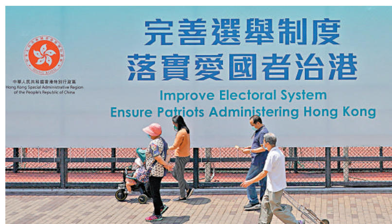
▲落實愛國者治港原則，特區政府能集中精力拚經濟、惠民生。

立法會議員周浩鼎表示，今次述職的安排，更加突出習近平主席和中央對香港的重視和關懷，對特首和特區政府工作的充分肯定和堅定支持。這一年來，李家超特首帶領的特區政府，敢於擔當，善作善成，能夠較迅速回應市民的多方面訴求，例如社區阻街問題得到改善，長者醫療券容許夫妻共用及將擴大使用範圍，為樓市減辣等。經濟方面，引進重點辦公室有20家企業正式落戶香港，預計創造過萬就業職位。他表示，中央堅定不移貫徹「一國兩制」方針長期不變，未來香港在背靠祖國，充分發揮「一國兩制」優勢下，必能再創高峰。