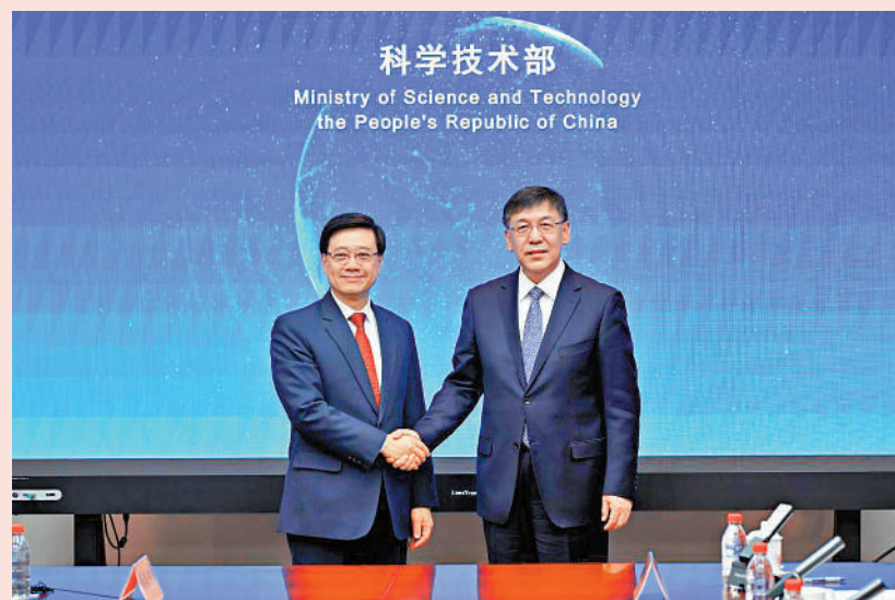
▲行政長官李家超（左）昨日拜訪國家科學技術部，並與部長陳俊傑（右）會面。

自由黨表示，自由黨立法會議員以及全體成員未來會一如既往支持特區政府依法施政，並會與新一屆區議會通誠合作，為特區政府建言獻策，共同維護國家安全、以市民為福祉，增加市民的獲得感及幸福感。