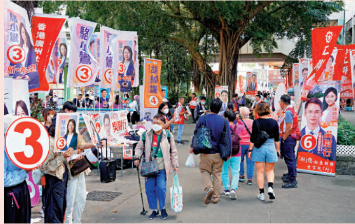
▲今屆區議會選舉順利舉行，愛國者治港進一步得到落實，意義重大。